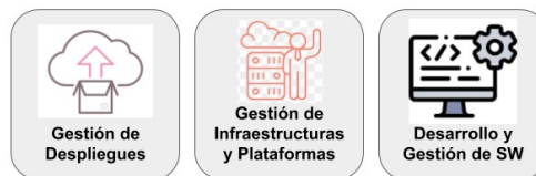
Ilustración 3: ITIL v4. Prácticas de Gestión Técnica