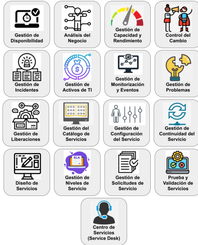
Ilustración 2: ITIL v4. Prácticas de Gestión de Servicios