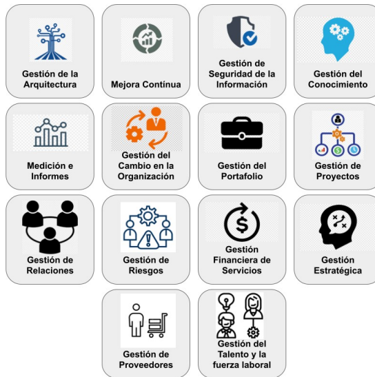
Ilustración 1: ITIL v4 . Prácticas de Gestión General