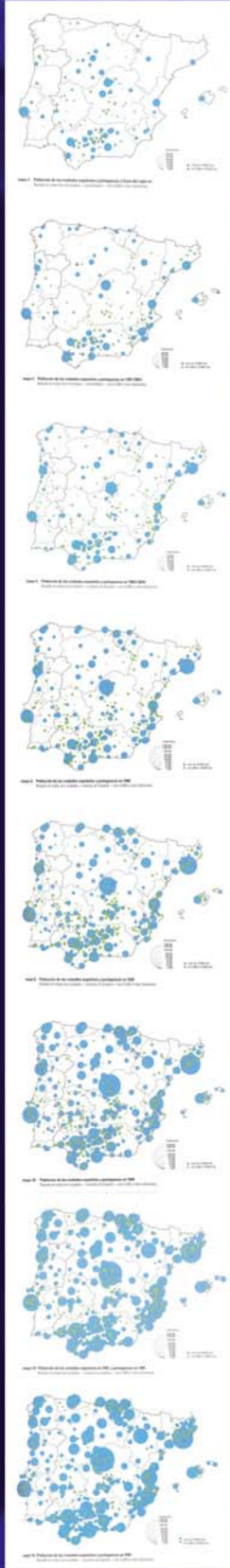
Población de las ciudades españolas y portuguesas entre 1951 y 1991.

Mapas 1 y 2. Población de las ciudades españolas y portuguesas a fines del siglo XVI. (Tomado de pp. 4-5)