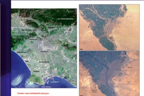
Dos ejemplos de megaciudades, Los Ángeles, 2001 y El Cairo en 1968 y 1998