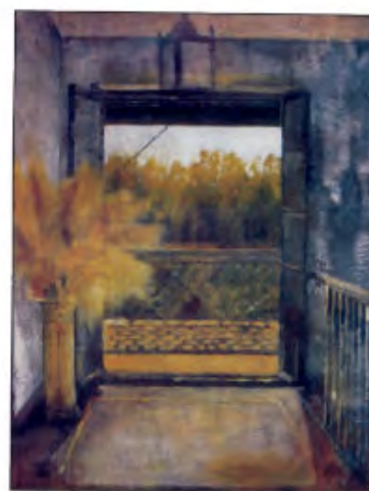
PORTADA: "Ventana de un cortijo" Técnica mixta sobre lienzo