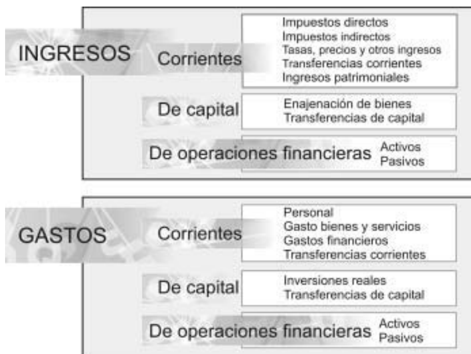
Cuadro 1. Estructura del presupuesto según la naturaleza económica de ingresos y gastos.