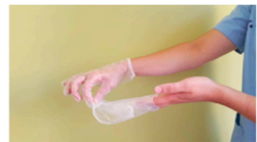
Retirar el guante en su totalidad