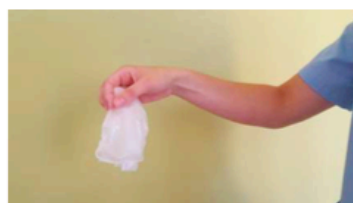
Retirar los dos guantes en el contenedor adecuado