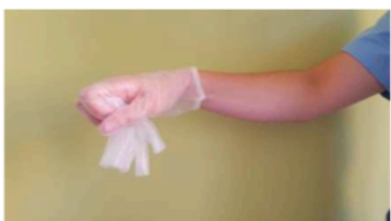
Recoger el primer guante con la otra mano