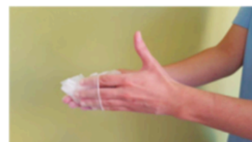
Retirar el guante sin tocar la parte externa del mismo