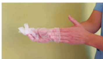
Retirar el segundo guante introduciendo los dedos por el interior