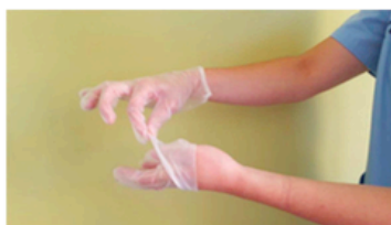
Retirar sin tocar la parte interior del guante