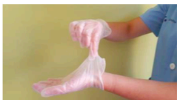
Pellizcar por el exterior del primer guante

Retirar el segundo guante: introduzca los dedos de la mano libre por el interior del guante de la otra mano, SIN TOCAR EL EXTERIOR DEL GUANTE. Retire el segundo guante sin tocar su parte externa y envolviendo al primero.