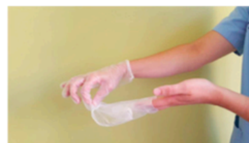
Retirar el guante en su totalidad