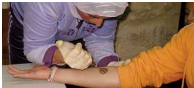
Taller de henna celebrado en Baeza (Jaén).

en cada momento y que este tipo de tatuajes se suelen hacer para conmemorar celebraciones tales como bodas, nacimientos... los más decorativos los lucen las mujeres mientras que los hombres, por lo general, sólo se tatúan un sol en la palma de la mano para que les dé suerte.