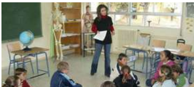
Campaña de sensibilización en los centros educativos de Alcaudete (Jaén).

Una de las actividades con la que más se disfrutó fue la charla ofrecida por dos vecinos de la localidad de origen senegalés y argelino en la que los menores, con la gran curiosidad que les caracteriza, hicieron