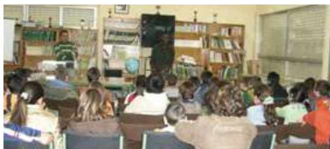
Charla ofrecida por dos vecinos de Alcaudete durante la campaña de sensibilización realizada en los centros educativos de Alcaudete (Jaén).

Tras la realización de las actividades se propuso al alumnado preparar una redacción, con todas las presentadas se organizará un concurso en el que se está trabajando actualmente.