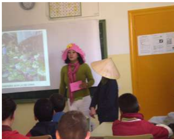
Campaña de sensibilización en los CEIP Eucaliptos y Prado de Olivares (Sevilla).

Fue una actividad bastante instructiva y la participación muy activa lo que hizo que la experiencia fuera amena y divertida.