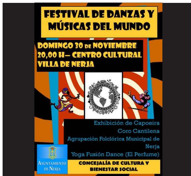
Cartel del festival de danzas y músicas del mundo realizado en Nerja (Málaga).

Festival de danzas y músicas del mundo: El día 30 de noviembre se clausuró el mes de las culturas con la celebración de este Festival en el que participaron distintos grupos de danzas y música: Capoeira, Yoga-Danza del Vientre y folclore de los pueblos cercanos.