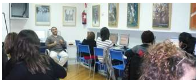
Curso sobre Gestión de subvenciones celebrado en Motril (Granada).

Fruto de los contactos con las organizaciones y asociaciones de inmigrantes y proinmigrantes se detectó la necesidad de formación e información referente a la financiación y búsqueda de recursos para sus actividades. La acción formativa sobre la Gestión de subvenciones se desarrolló los días 27 y 28 de noviembre y fue financiada a través del FAIREA.