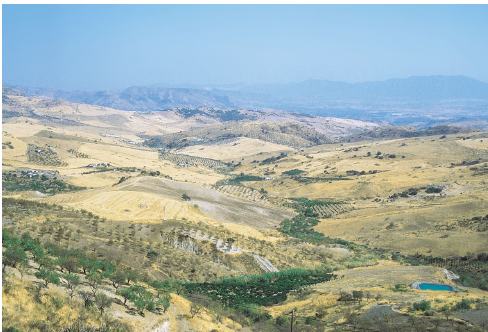
Aspecto de los territorios termomediterráneos de la Axarquía malagueña desde las proximidades de Carratraca.