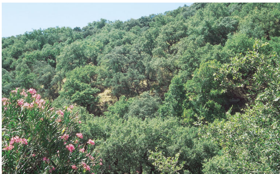
Barranco de la Sanguijuela, próximo a Ronda (Málaga), donde domina el termotipo mesomediterráneo inferior.