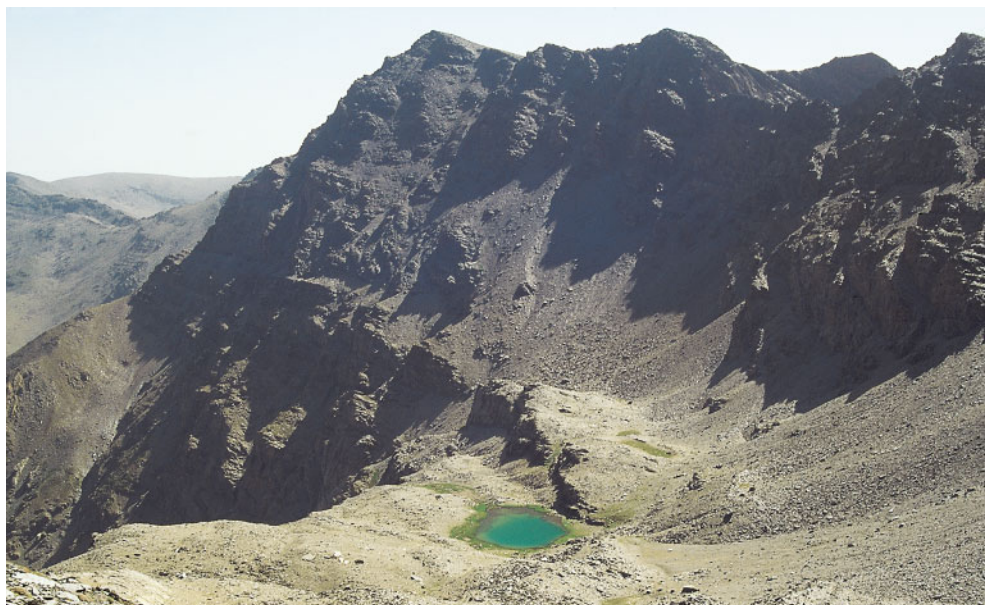
La laguna de la Mosca y el pico de la Alcazaba (Sierra Nevada, Granada) son el refugio crioromediterráneo de un amplio contingente de especies endémicas.