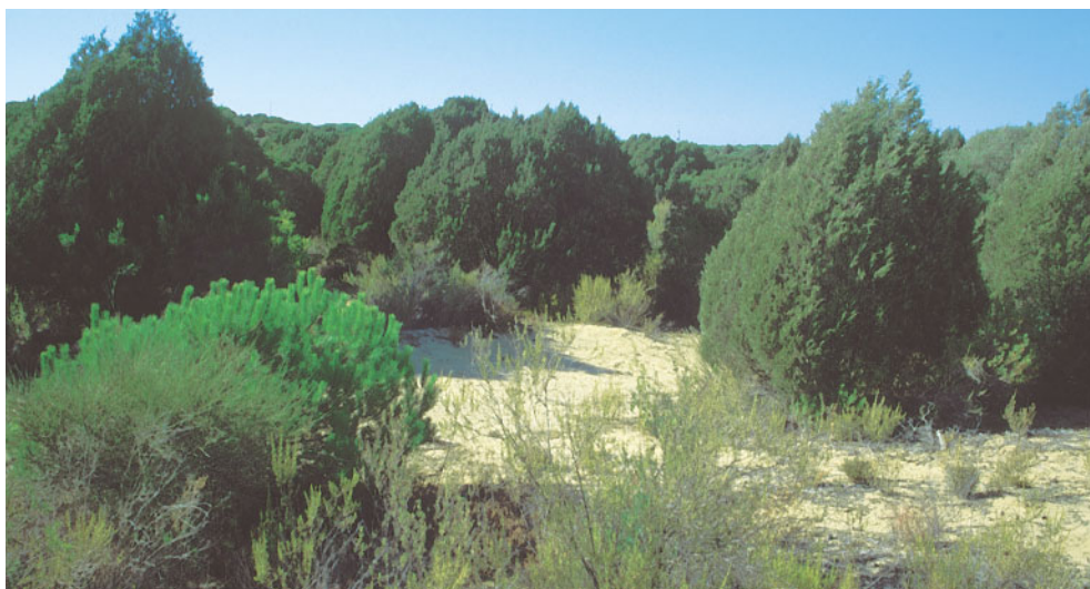
Sabinares costeros (Psa) en Matalascañas (Huelva), pertenecientes al distrito termomediterráneo Onubense Litoral.