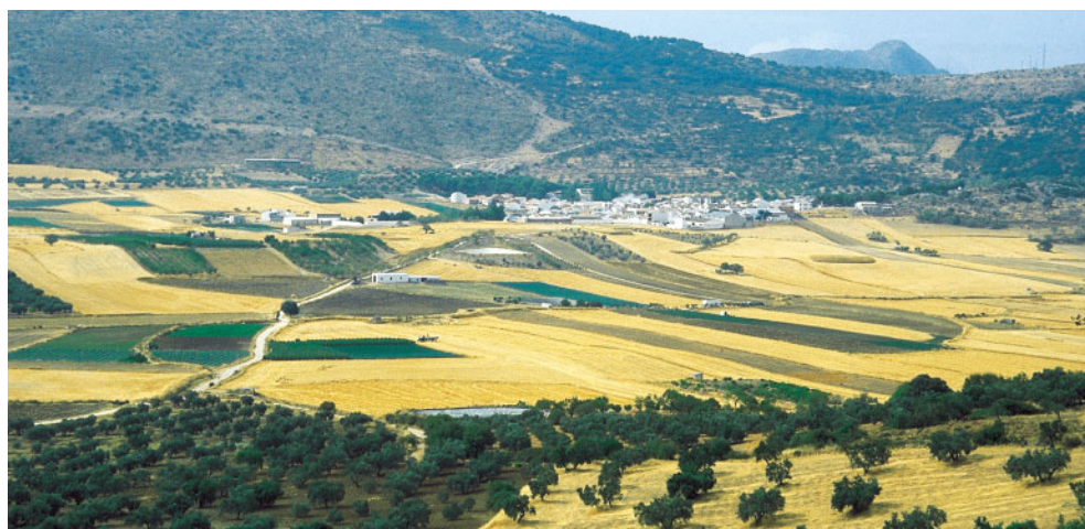
Mesomediterráneo inferior en las proximidades de Alfarnate (Málaga).