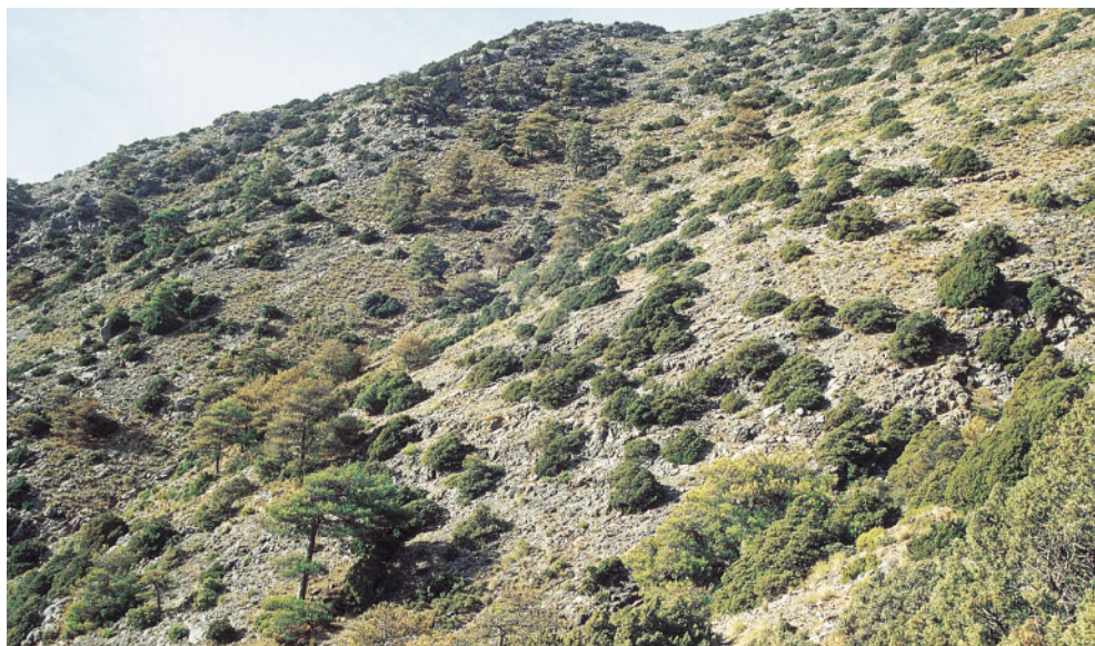
Pinar-sabinar edafoxerófilo supramediterráneo en el cerro Quintana (sierra de Baza, Granada). JpPs.