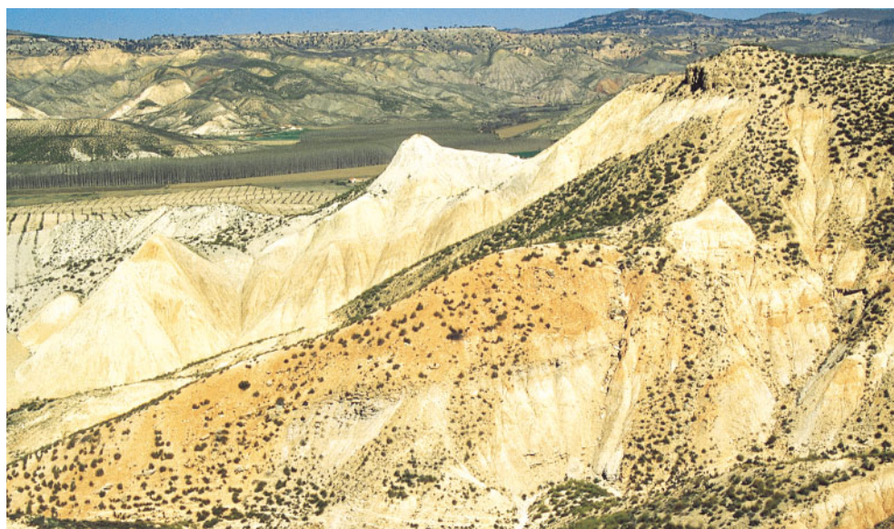
Acarcavamientos producidos en el río Fardes (depresión de Guadix), pertenecientes al distrito biogeográfico Guadiciano-Bastetano, dominado en su práctica totalidad por el termotipo mesomediterráneo.