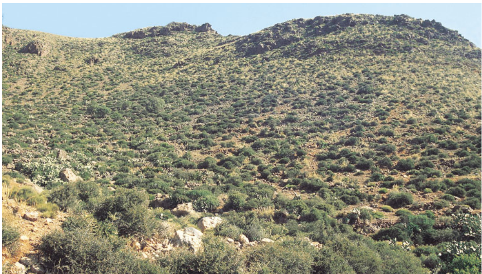
Termotipo termomediterráneo en la sierra del Cabo de Gata (Almería). Se pueden apreciar los cambronales de Periploca laevigata (MePI).