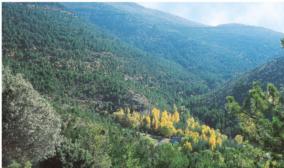
Barranco de la Canaleja y calar de Santa Bárbara (sierra de Baza, Granada), áreas supra y oromediterráneas del distrito biogeográfico Serrano-Bacense (sector Guadiciano-Bacense, provincia Bética).