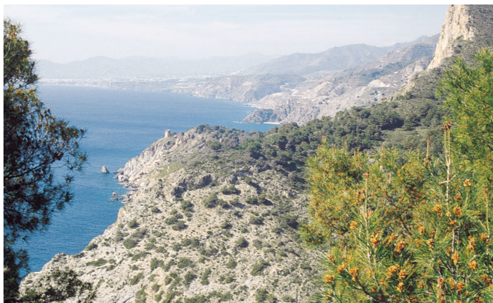
Costa termomediterránea granadina (Cerro Gordo, próximo a Almuñécar).