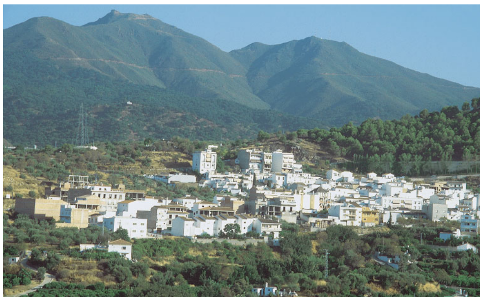
Monda (Málaga), pertenece al termotipo termomediterráneo del distrito biogeográfico Bermejense, al fondo la sierra de las Alpujalias. SmQr.