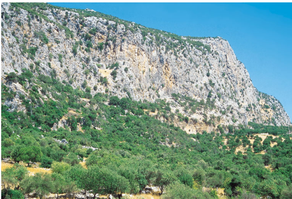
Sierra del Algarrobal (Ubrique, Cádiz), en la que aparecen comunidades edafoferófilas termomediterráneas.