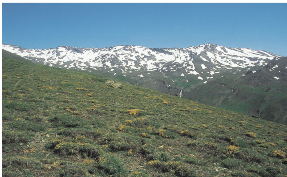
Piornales-enebrales (GbJn) oromediterráneos sobre sustrato silíceo en Sierra Nevada, al fondo los Tajos de la Virgen.