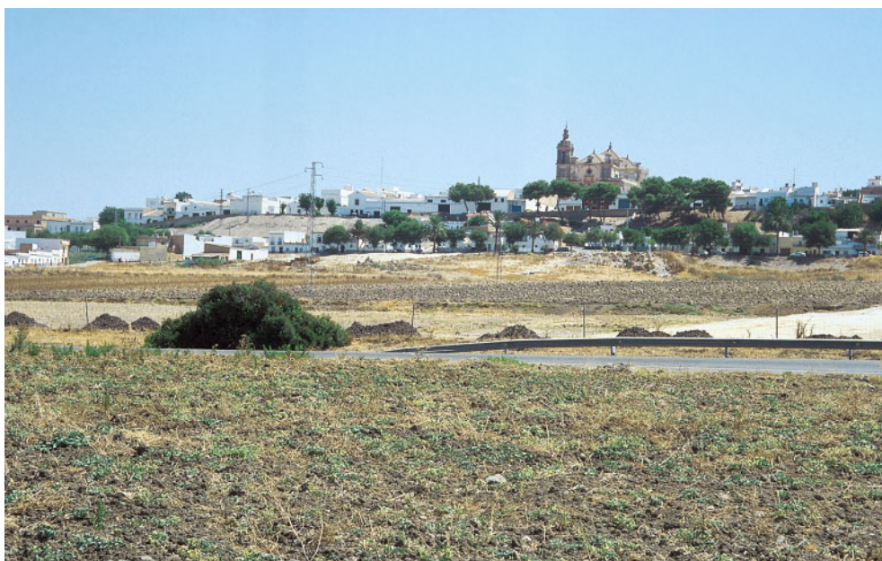
Las Cabezas de San Juan (Sevilla), pertenece al termotipo termomediterráneo Hispalense que penetra por el valle del Guadalquivir hacia el interior de Andalucía.