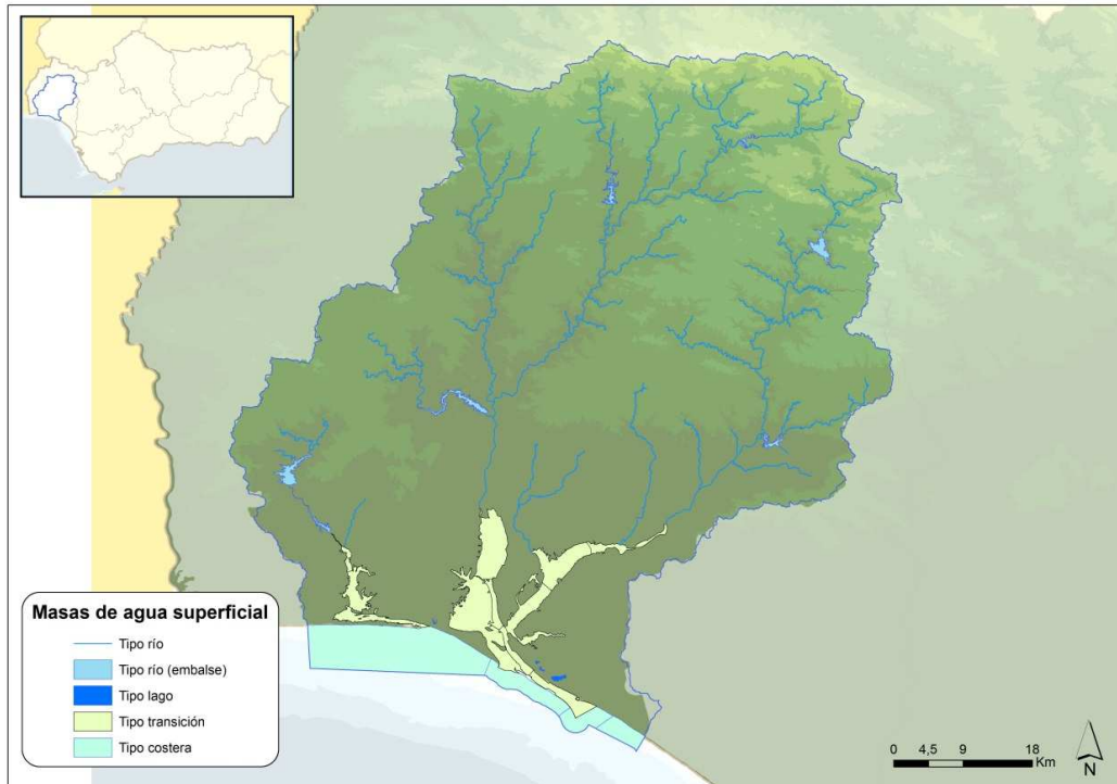
Figura 5-1 .Masas de agua superficial de la DHTOP.