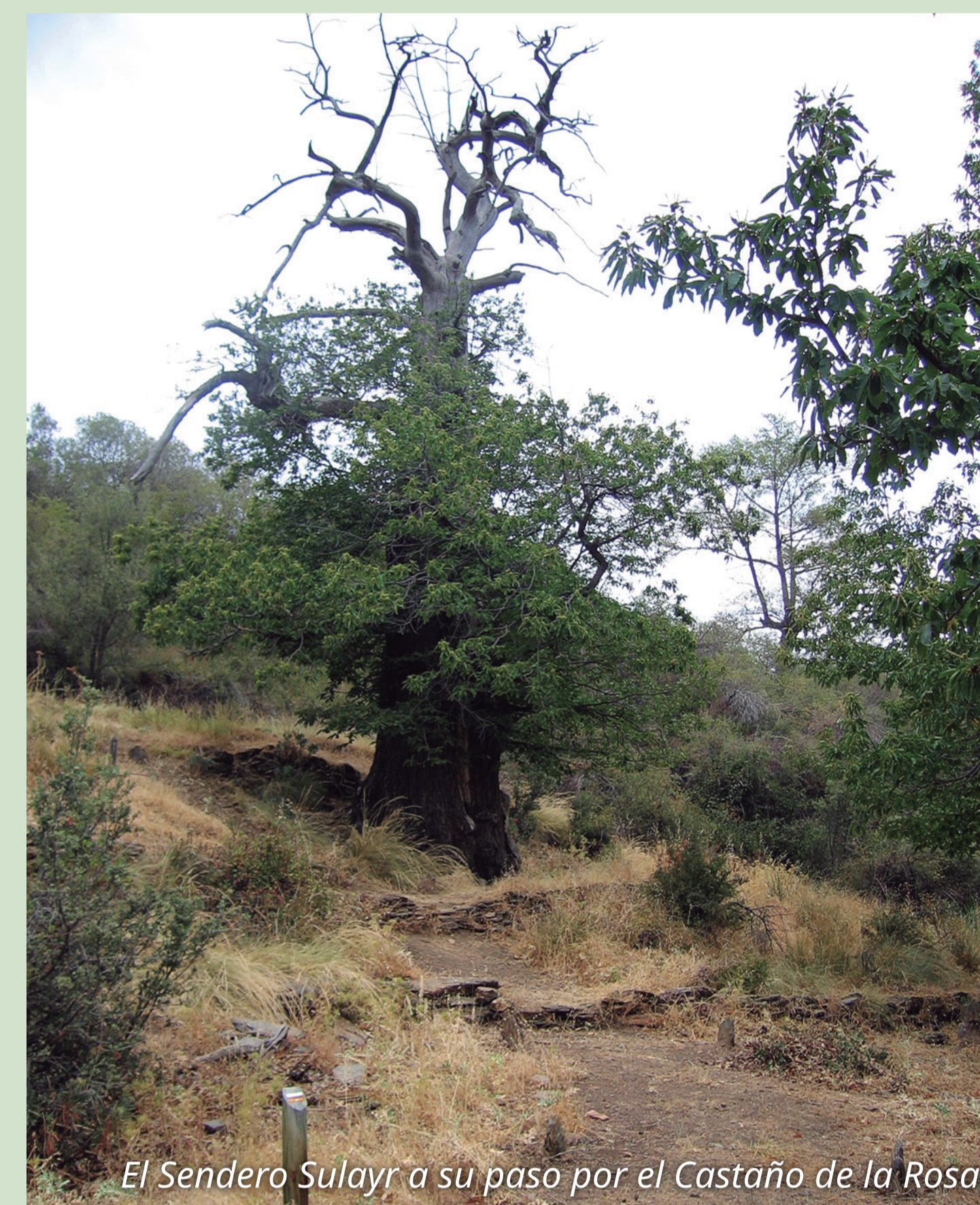
El Sendero Sulayr a su paso por el Castaño de la Rosa