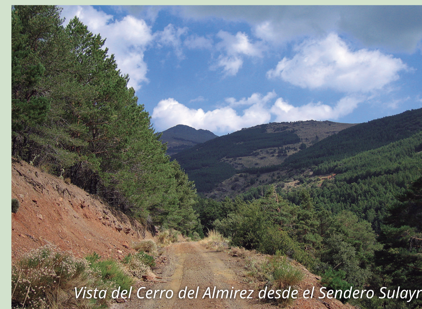
Vista del Cerro del Almirez desde el Sendero Sulayr