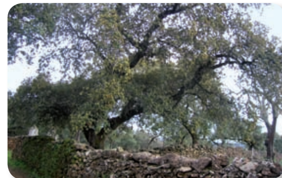
Tanto los muros de piedra que delimitan fincas, como los encinares y olivares adehesados son elementos emblemáticos de los paisajes del parque natural, que evocan modos de vida y de explotación de la tierra que se mantuvieron casi intocables durante siglos, y que sólo se superaron en tiempos recientes.