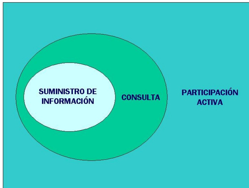
Figura 3. Niveles de participación.