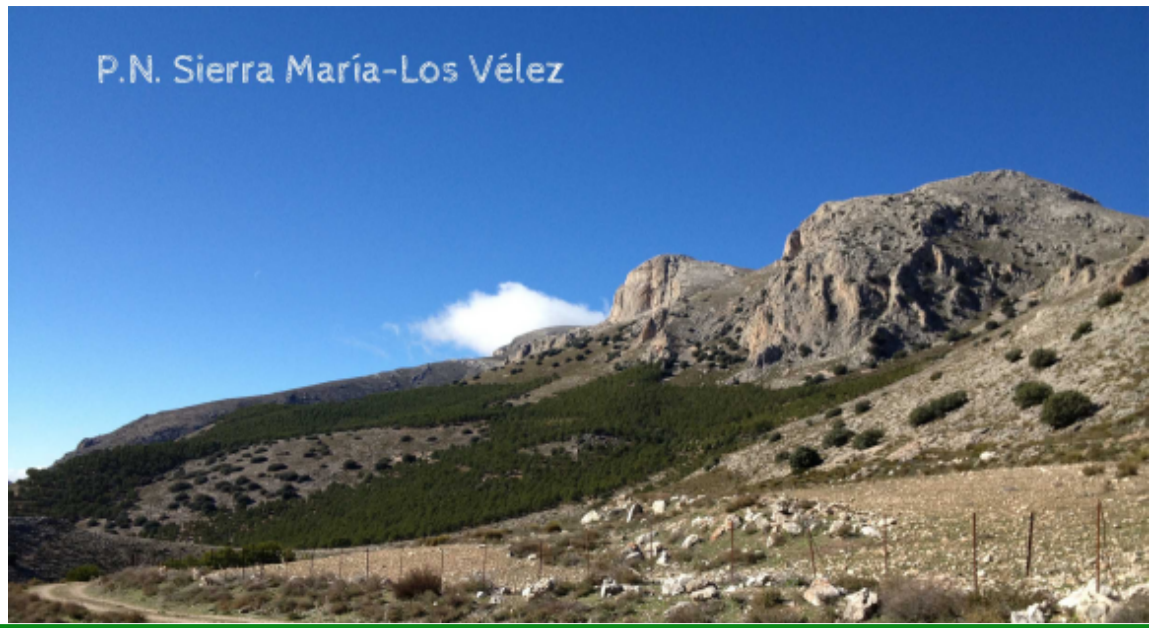
P.N. Sierra María-Los Vélez