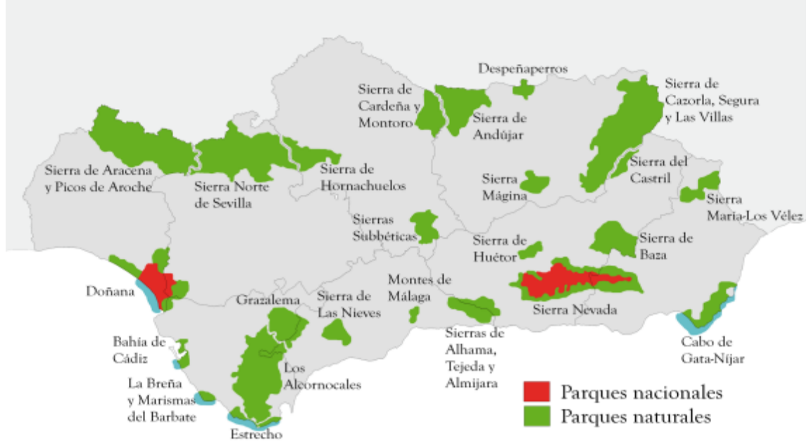
Parques Naturales Andaluces