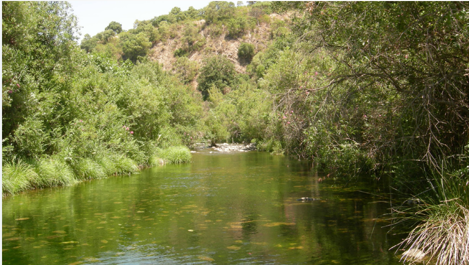
Río Verde aguas arriba de la confluencia con el Arroyo de Albornoque