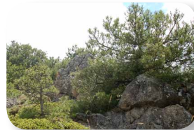
Detalle de las plantas adoptando forma de iglú para protegerse del frío

Nuestra ruta comienza en el paraje conocido como la Cuesta de los Cerrillos (ver [1] en el mapa), dejando a la derecha el conocido sendero de gran recorrido GR7 que atraviesa la sierra de Baza. Desde aquí, iremos poco a poco ascendiendo hasta remontar la Cañada del Cortijillo.