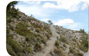
El sendero nos conduce por multitud de collados que nos regalan impresionantes vistas

Son muchas las especies vegetales que se han adaptado a esta zona, dándole el valor y la riqueza natural anteriormente mencionada, y todas presentan similitudes, ¿os atrevéis a identificarlas? Observemos a nuestro alrededor y fijémonos cómo estos endemismos se caracterizan por presentar un porte bajo, la mayoría son herbáceas, sus hojas y