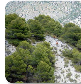
Cueva del Zanahoria, usada como refugio para ganado

Nos encontramos en una zona de alto valor ambiental, si miramos a nuestro alrededor veremos que el color blanquecino, tanto del camino como el de los cerros aledaños, domina toda nuestra visión. Este tipo de suelo está compuesto por arenas dolomíticas, lo que le da el carácter peculiar a esta zona de la sierra, ya que estos suelos que ahora estamos pisando son muy pobres en nutrientes y tienen poca capacidad de retención de agua, debido a su estructura suelta y arenosa.