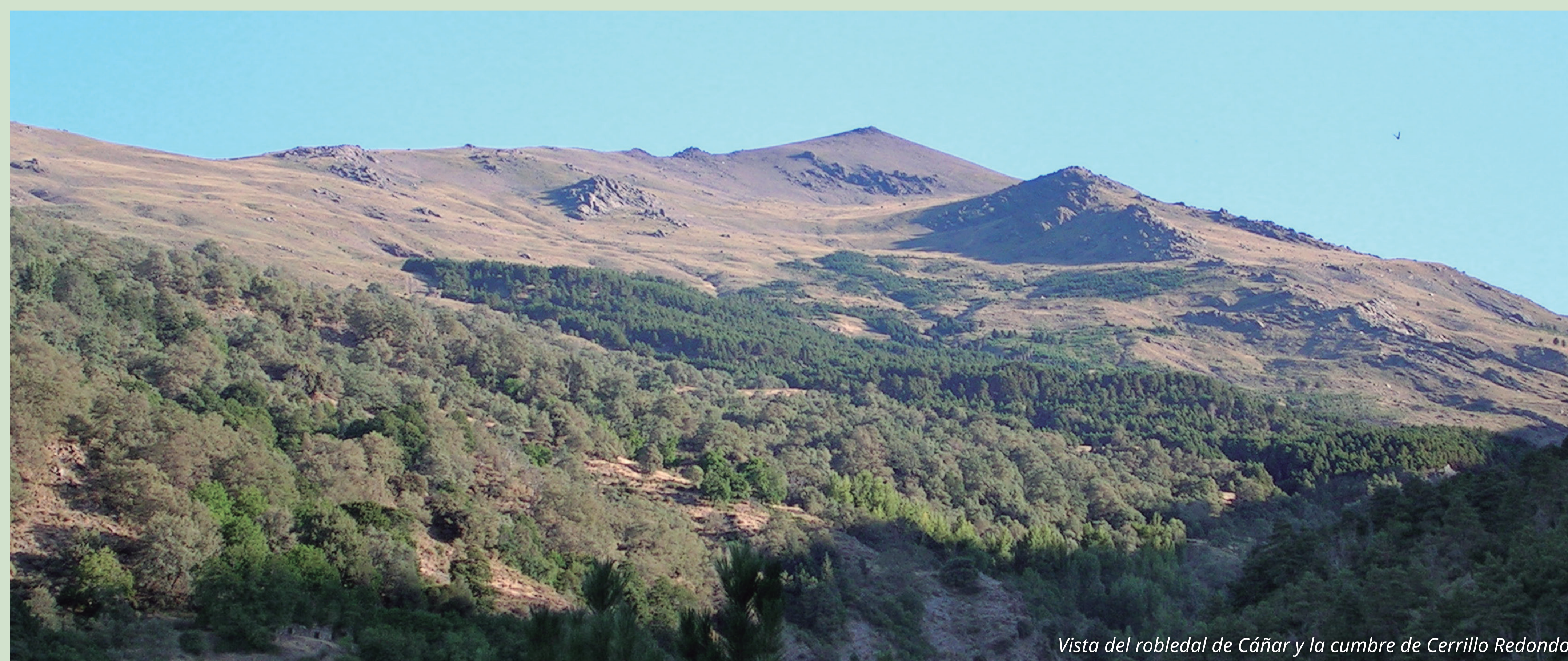
Vista del robledal de Cáñar y la cumbre de Cerrillo Redondo

SIERRA NEVADA PARQUE NACIONAL PARQUE NATURAL