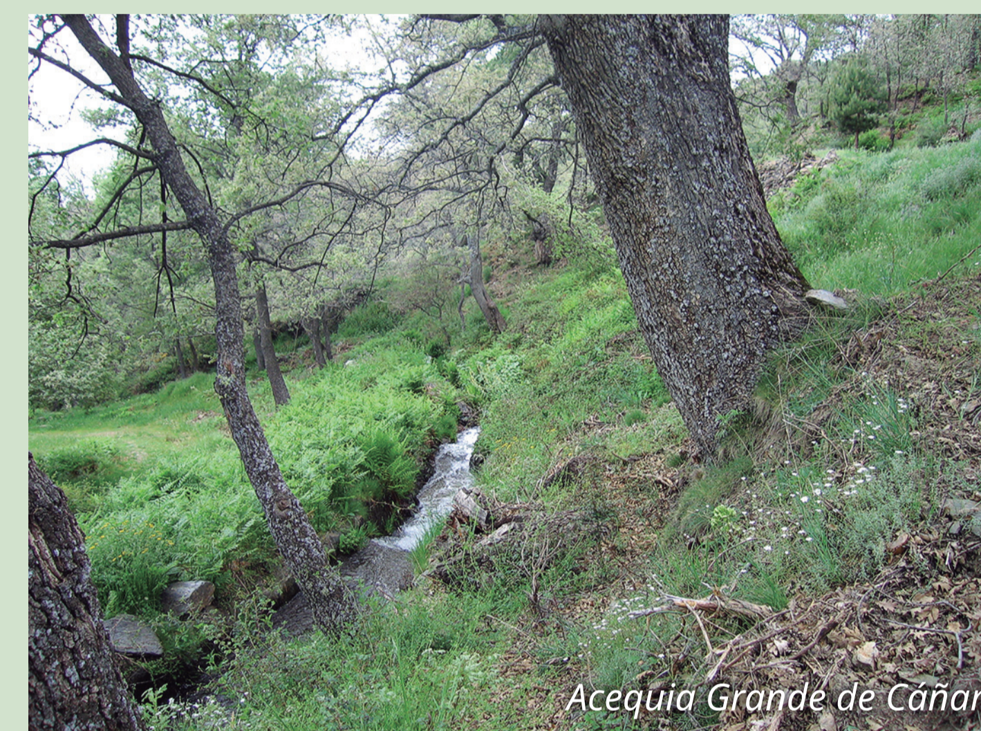
Acequia Grande de Cáñar

Para acceder a este recorrido tomaremos la pista señalizada que desde el centro del pueblo asciende a la sierra. A 9,8 km conectamos con el Sulayr, que discurre por la pista forestal de Puente Palo, por un valioso robledal. Se recomienda dirigirse hacia la derecha, hacia el bello paraje de Puente Palo. Allí encontraremos el cartel-mapa de los tramos 5 y 4 del Sulayr. Desde este enclave privilegiado podemos tomar en una u otra dirección el recorrido circular del Sendero Sulayr, bien hacia el este por su cuarto tramo Puente Palo-Capileira, o en sentido opuesto (tramo 5) hacia el valle del río Lanjarón y el paraje de Tello.