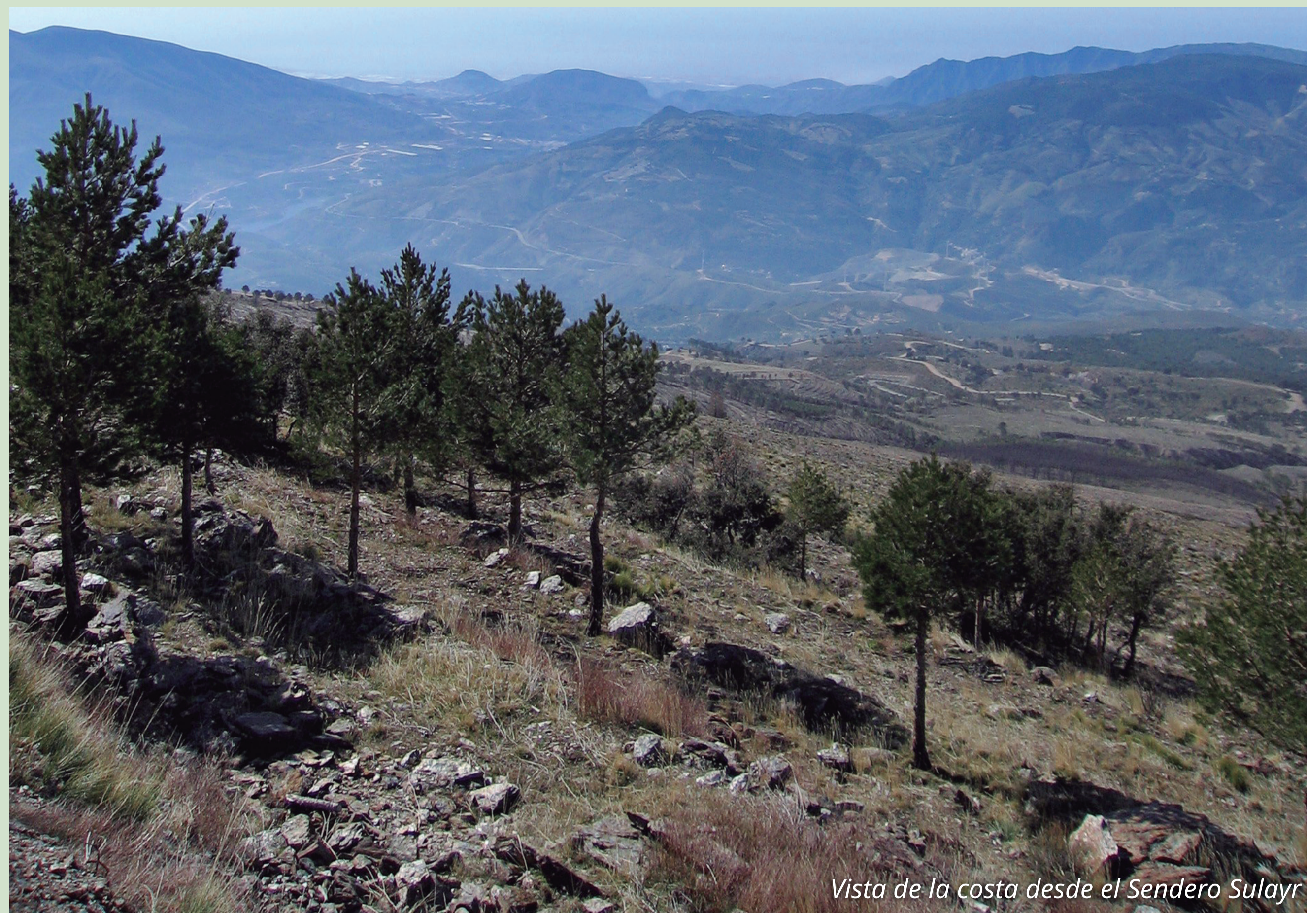
Vista de la costa desde el Sendero Sulayr