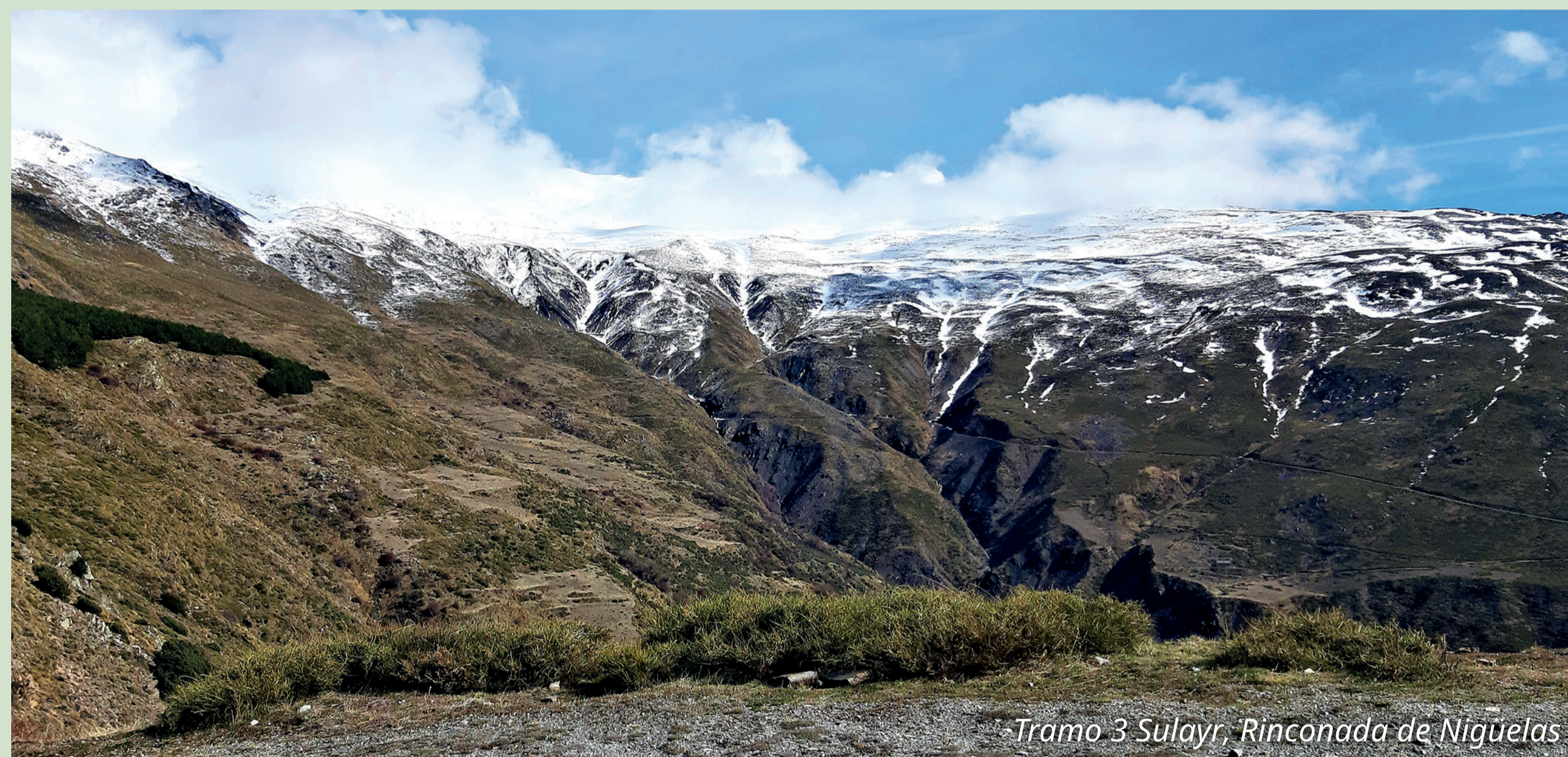
Tramo 3 Sulayr, Rinconada de Nigüelas

Este gran itinerario panorámico recorre la media y alta montaña, atravesando lomas y barrancos, bosques, prados y piornales, con una flora y fauna muy diversa. También encontramos antiguos cortijos, banales, acequias, balsas, apriscos... que han contribuido a la formación del paisaje igualmente único de Sierra Nevada.