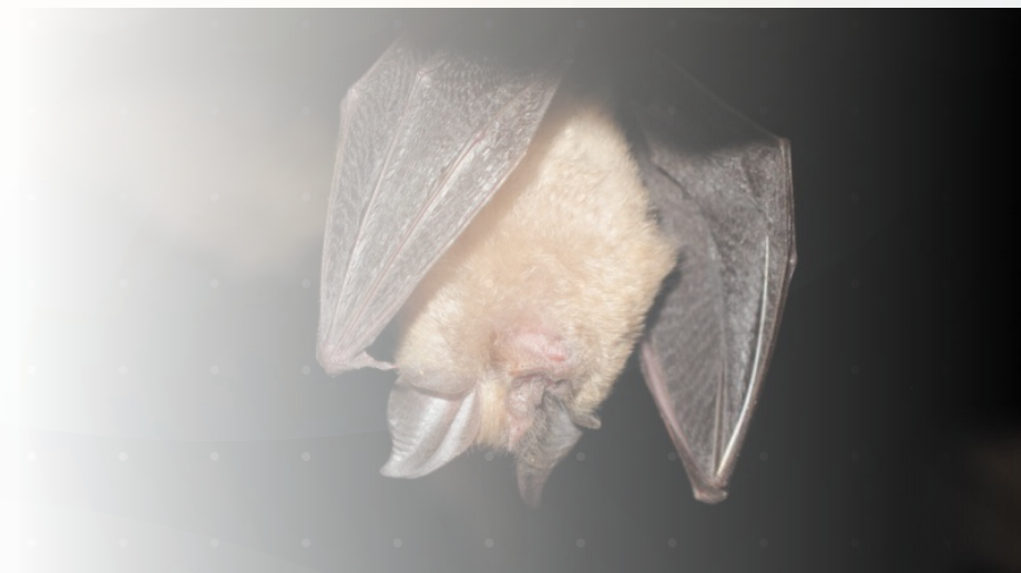
Murciélago grande de Herradura ( Rhinolophus ferrumequinum ). Autor: Diego García