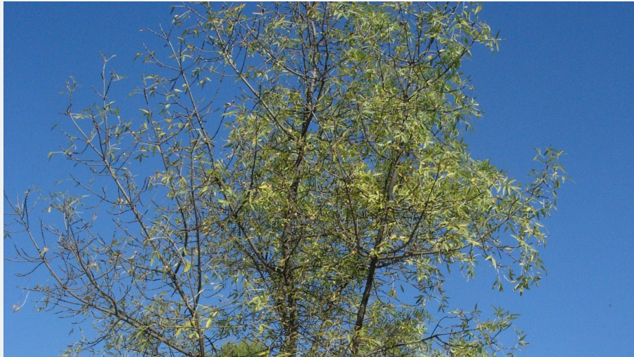
Fraxinus angustifolia . Autores: Equipo técnico del Jardín Botánico El Castillejo