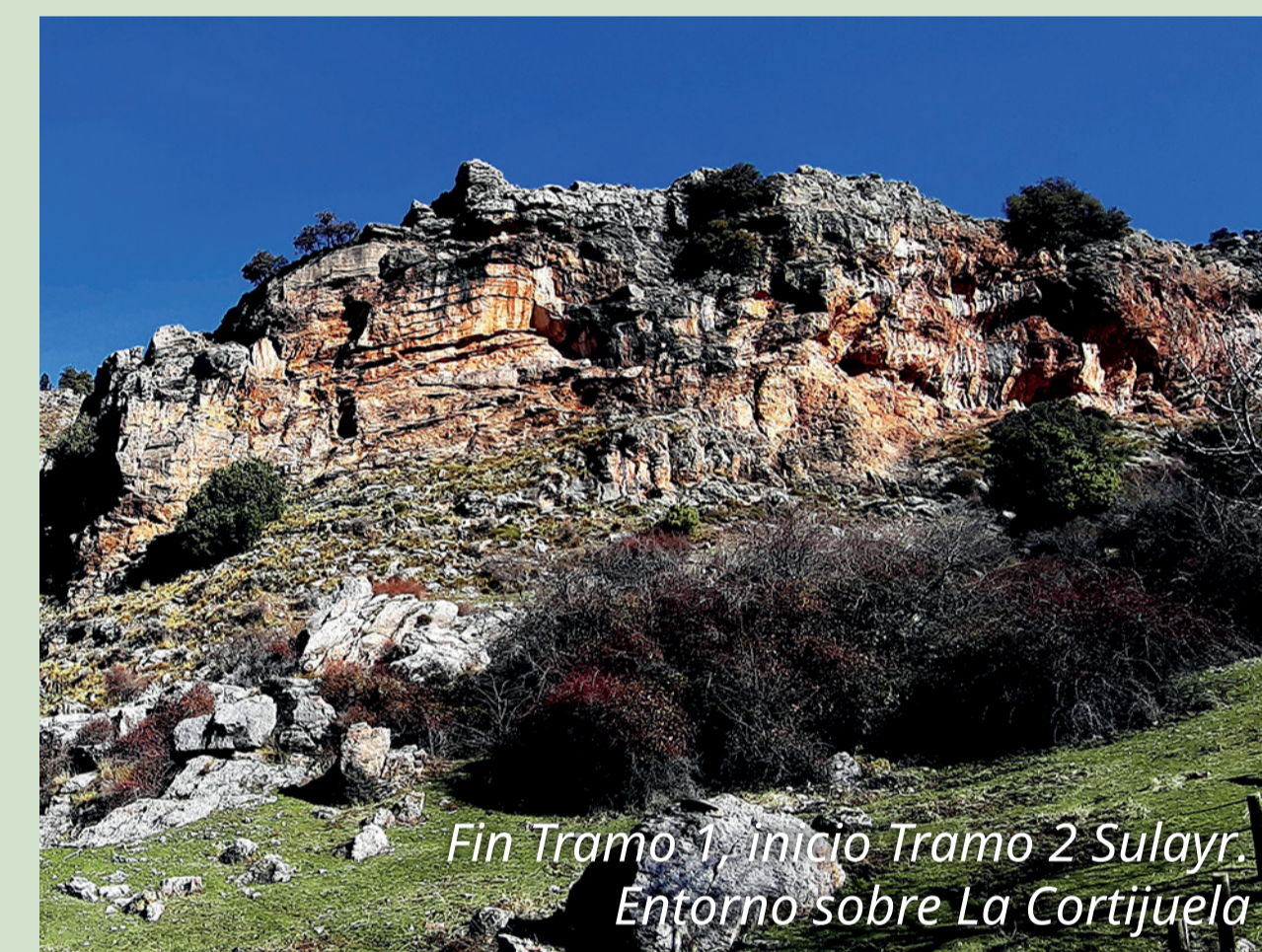
Fin Tramo 1, inicio Tramo 2 Sulayr. Entorno sobre La Cortijuela.

El recorrido del Sulayr en torno a Sierra Nevada tiene en el término municipal de Monachil su tramo 1, Pista de San Jerónimo-La Cortijuela. Este tramo se inicia en las cercanías del Centro de Visitantes El Dornajo. Durante este trayecto por caminos y pistas forestales se cruza el Río Monachil y su bello robledal, disfrutando en el Collado Matas Verdes unas vistas extraordinarias de este valle.