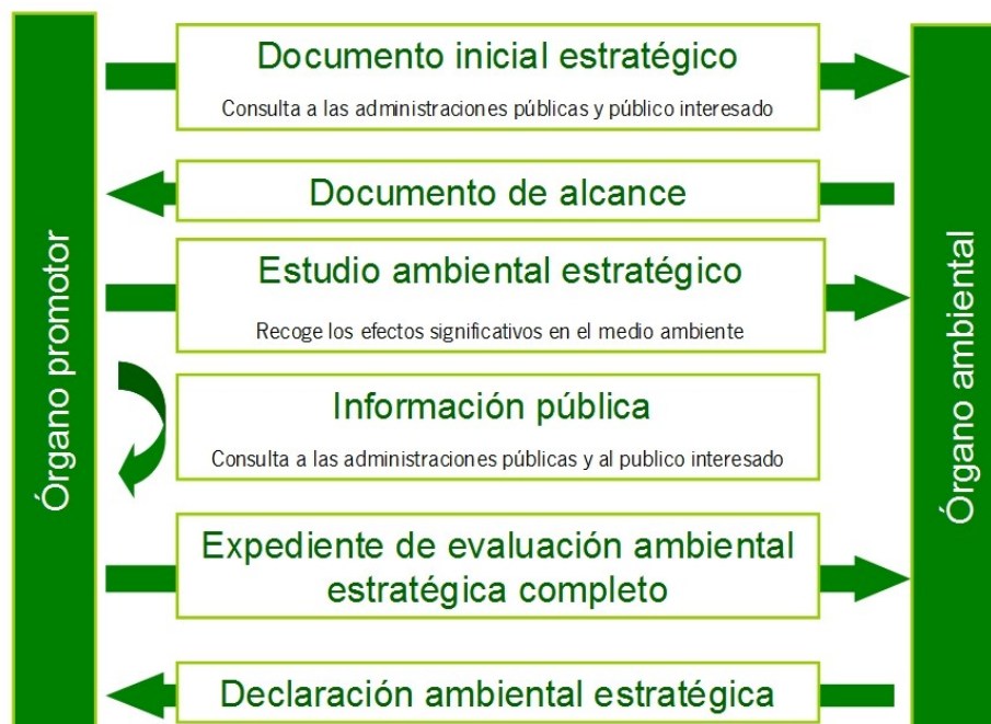
Interacción y fases del proceso de Evaluación Ambiental

La versión preliminar del II Plan de Desarrollo y el Estudio Ambiental Estratégico se someterán, durante un plazo mínimo de 45 días, a información pública. Una vez finalizada la fase de información pública y de consultas y tomando en consideración las alegaciones formuladas durante las mismas, se modificará el Estudio Ambiental Estratégico y se elaborará la propuesta final del II Plan de Desarrollo Sostenible, que formarán el Expediente de Evaluación Ambiental, remitiéndose al órgano ambiental para que éste formule la Declaración Ambiental Estratégica, el cual se incorporará a la versión final del II Plan de Desarrollo Sostenible.