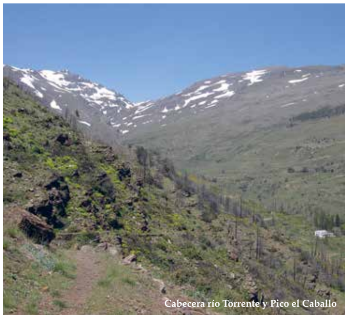
Cabecera río Torrente y Pico el Caballo