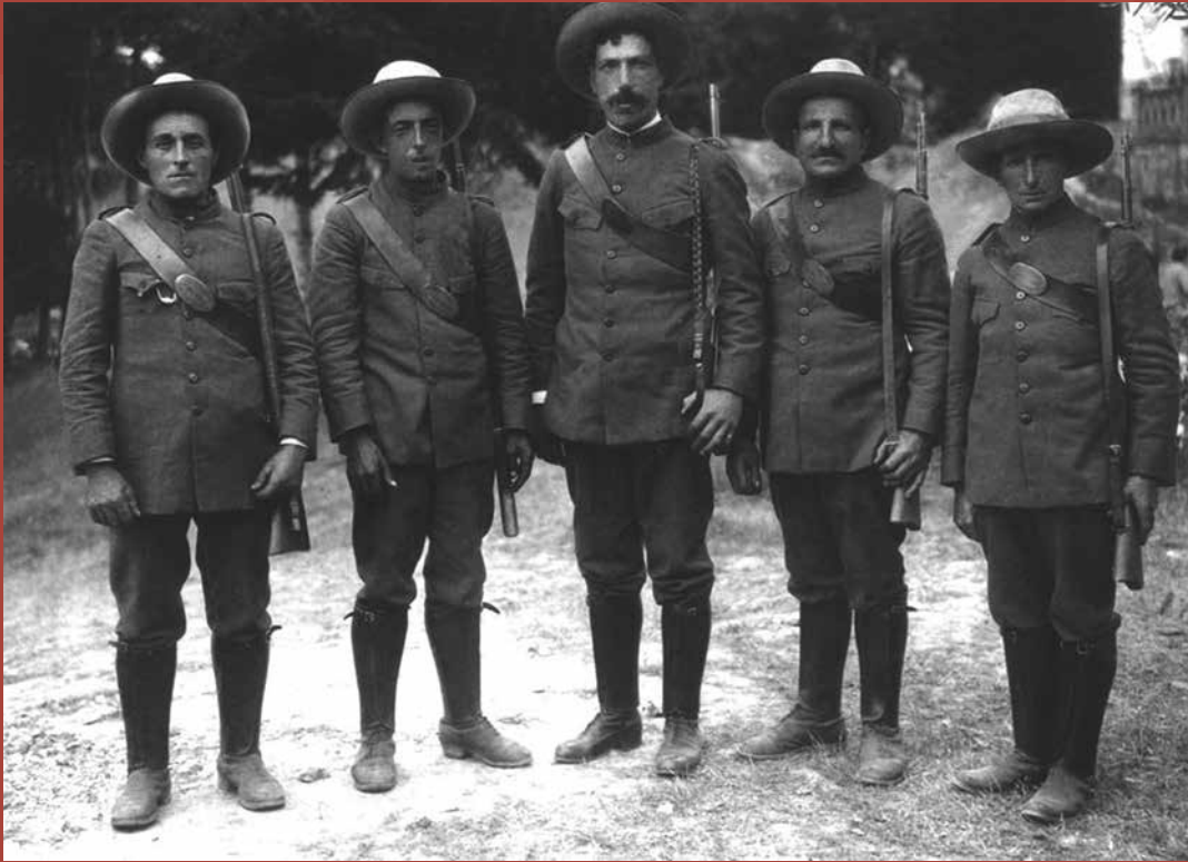
First rangers of the Picos de Europa National Park 1918