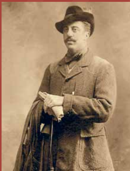
D. Pedro Pidal, Marqués de Villaviciosa