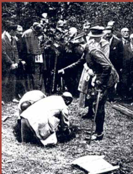
El Rey Alfonso XIII en el Parque Nacional de Covadonga

Desde entonces cada vez más, visitar los parques nacionales, se contempla como una forma de ocio saludable, diferente y de calidad, siendo la observación de la naturaleza mediante la práctica del senderismo una de las actividades preferidas de los visitantes. Un paseo por un parque nacional, puede convertirse en una experiencia magnífica para despertar nuestros sentidos, habitualmente apagados por el exceso de ruido, estrés y contaminación.