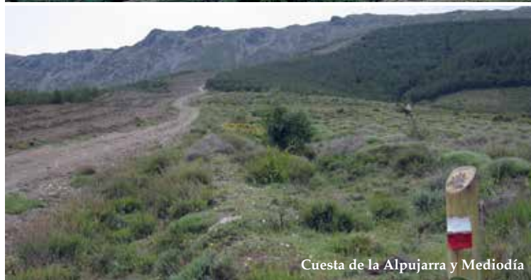
Cuesta de la Alpujarra y Mediodía