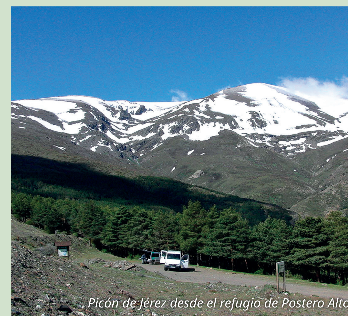
Picón de Jérez desde el refugio de Postero Alto