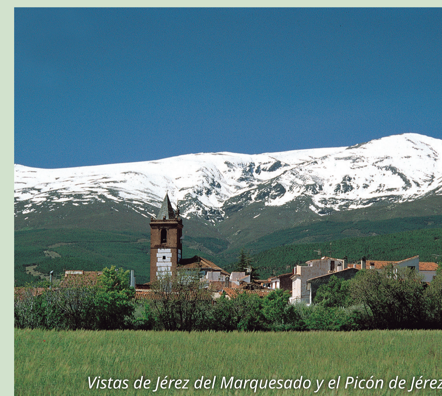
Vistas de Jérez del Marquesado y el Picón de Jérez