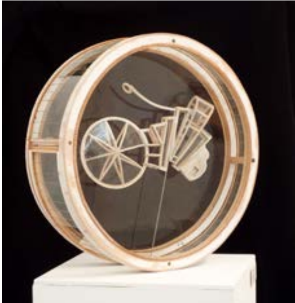
Espacio vital nº 1 (Proyecto rechazado por una celebre caja de luz)