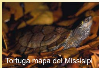
Tortuga mapa del Missisipi