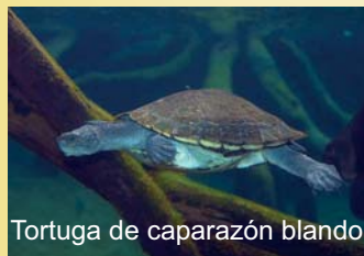
Tortuga de caparazón blando

Otras especies que se están importando como mascotas son la Tortuga mapa del Mississipi ( Graptemys kohni ) , el Galápagos pintado ( Chrysemys picta ) , y la torga mordedora ( Chelydra serpentina ) , originarias de Norteamérica.