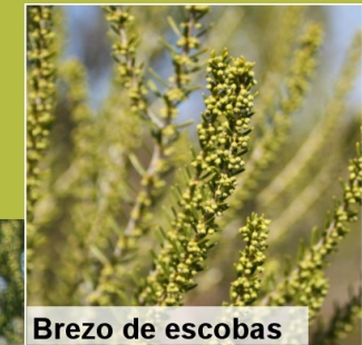
Brezo de escobas

En el monte negro, el brezo de escobas está acompañado por la brecina, el tojo, y una jara de flor blanca relativamente grande, la jara peluda ( Cistus psilosepalus ).