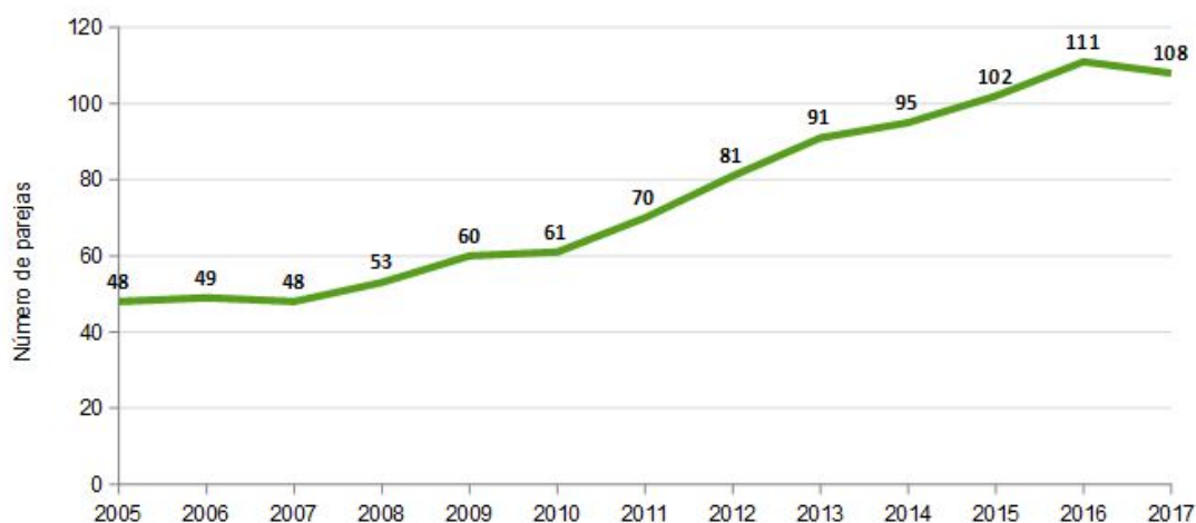
Poblaciones reproductoras de lince ibérico en Andalucía 2002-2017