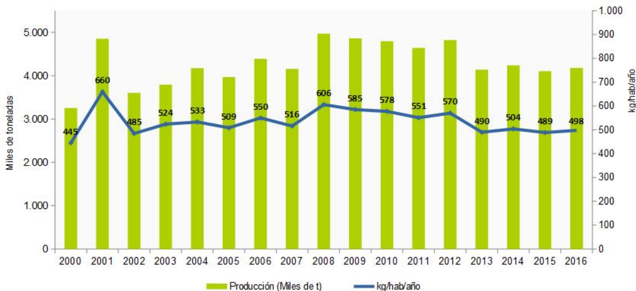
Evolución de la producción de residuos municipales en Andalucía, 2000-2016