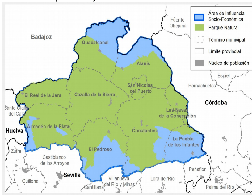
Parque Natural y área de influencia socioeconómica