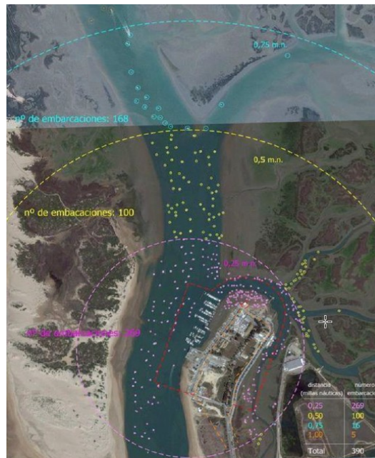
Ilustración 14 del documento ambiental estratégico: Embarcaciones fondeadas y varadas (marzo 2016).

La ampliación de la zona de estancia de embarcaciones en el caño del Alcornocal hasta un máximo de 575 embarcaciones en puestos de atraque o fondeos no solo mantendría la actual problemática ambiental asociada a los fondeaderos dispersos sobre el parque natural, sino que incluso podría incrementarla. No hay garantías de que esta ampliación suponga la retirada de embarcaciones fondeadas irregularmente en el caño de Sancti-Petri (dentro del parque natural), ni tampoco que sirva para regular las que actualmente se ubican en la zona de servicio del puerto fuera de la zona de