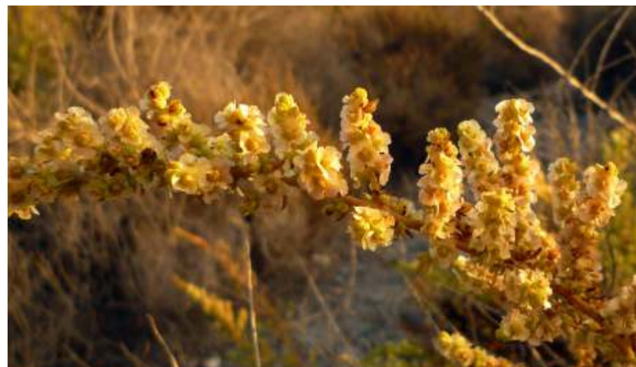
Salsola Papillosa . Autor: Nanosanchez CC BY-SA 4.0