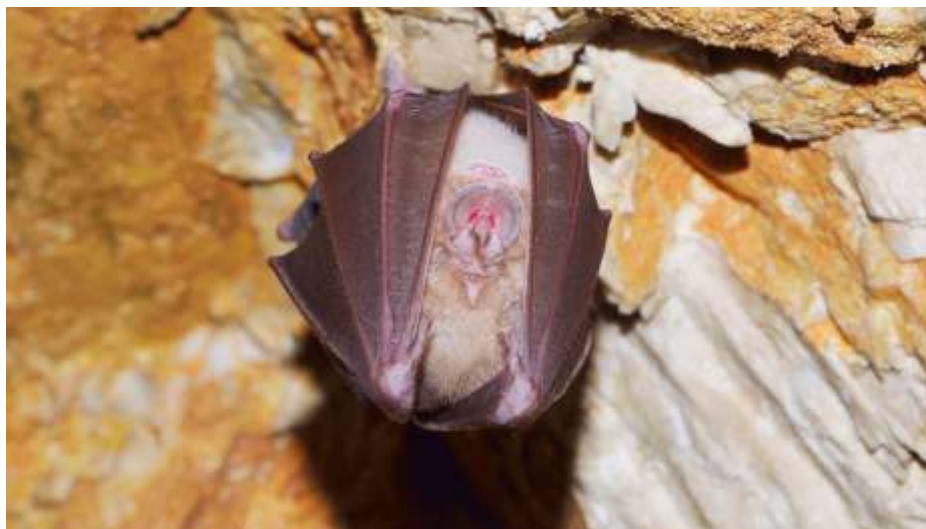
Murciélago pequeño de herradura ( Rhinolophus hipposideros).