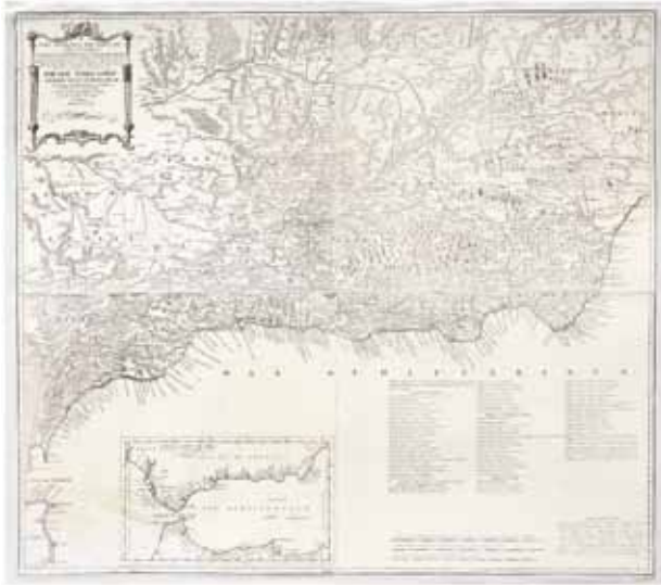
1795. LÓPEZ, Tomás. Mapa geográfico del Reino de Granada. Biblioteca de Andalucía.

camino de regreso con sus mulos cargados de nieve para la venta y reparto en la ciudad.