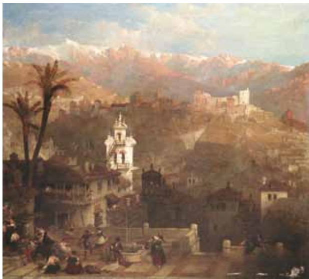
1833 ca. ROBERTS, David. Fortaleza de la Alhambra en Granada. Óleo sobre lienzo. Colección de arte CajaGRANADA.