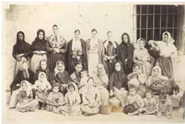
1894. ORTIZ AGUILERA, Federico. Juviles grupo. La Alpujarra [álbum fotográfico]. Positivo sobre papel albuminado. Colección de la familia de F. Izquierdo.

Va a ser en la centuria del XIX, cuando este paisaje comience a cambiar lentamente por la introducción de nuevas vías de explotación de los recursos. Destaca como protagonista la minería y las tímidas explotaciones de aguas termales y curativas. Así pues, la sierra como territorio mítico y casi inexplorado unas décadas antes,