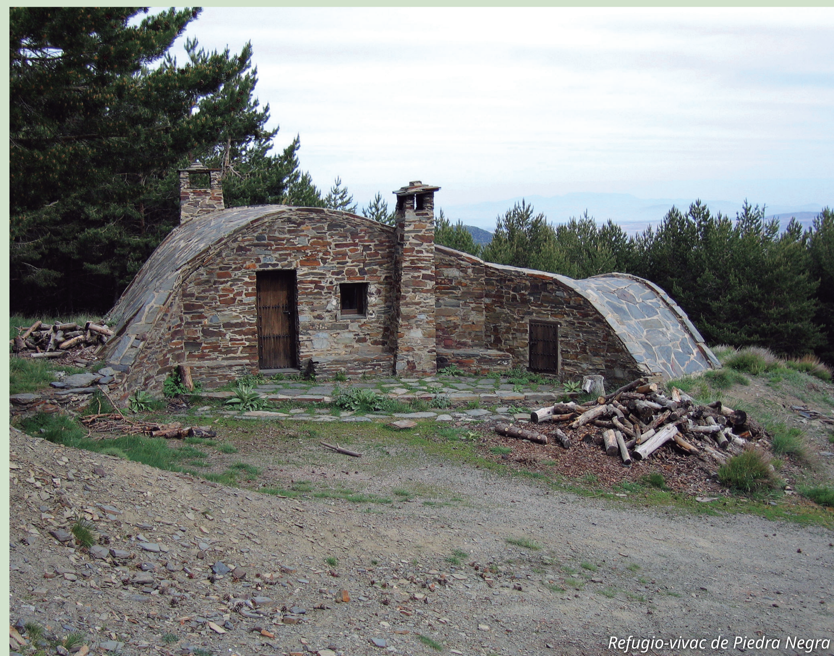
Refugio-vivac de Piedra Negra