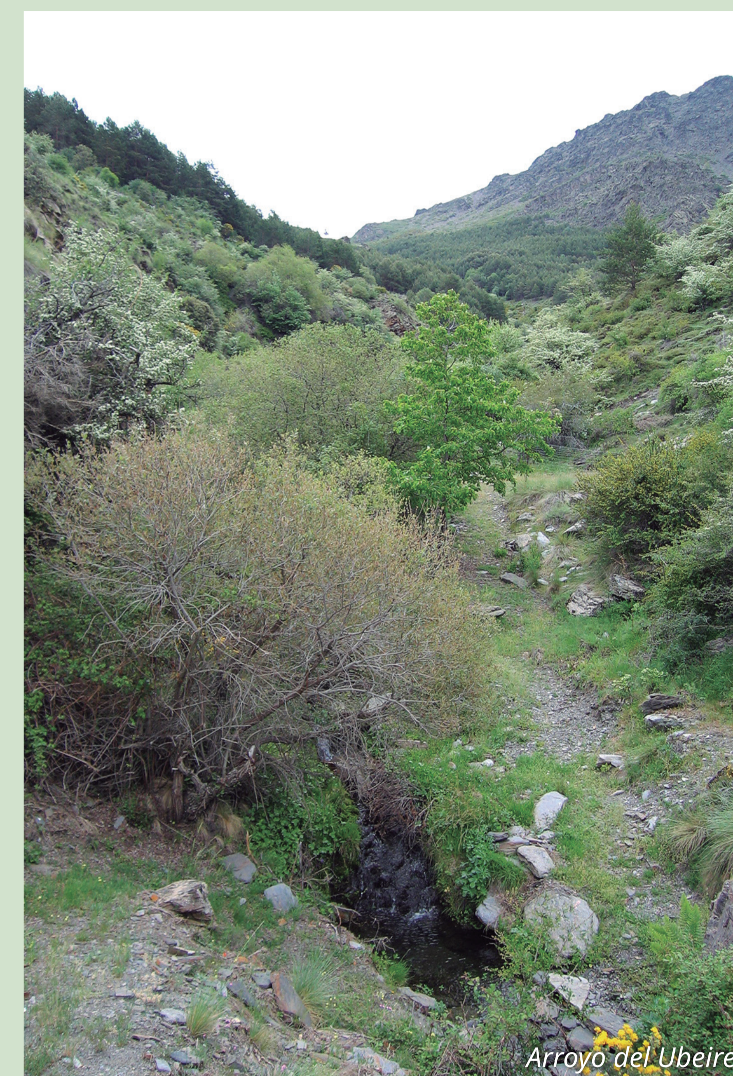
Arroyo del Ubeire