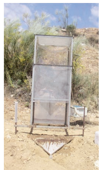
Simulateur de pluie