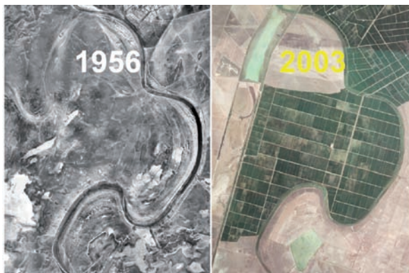
Carte des Usages et Couvertures Végétales du Sol 1956

La diffusion des résultats obtenus, en marge des voies citées précédemment, a également été effectuée au travers d'autres supports technologiques et scientifiques : un espace web a été aménagé au sein du site officiel du Ministère Régional de l'Environnement ( www.cma.junta-andalucia.es ), contenant une description du projet, les documents élaborés, etc., et où il est de plus possible de consulter une multitude d'aspects environnementaux propres à la région. D'autre part, plusieurs articles ont été publiés au sein de congrès et de revues consacrés à l'environnement, et divers posters et communications ont été présentés sur le thème du développement méthodologique et du diagnostic de la désertification en Andalousie.