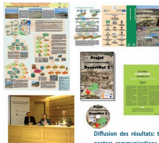
Diffusion des résultats: triptyque, posters, communications, livre, .....