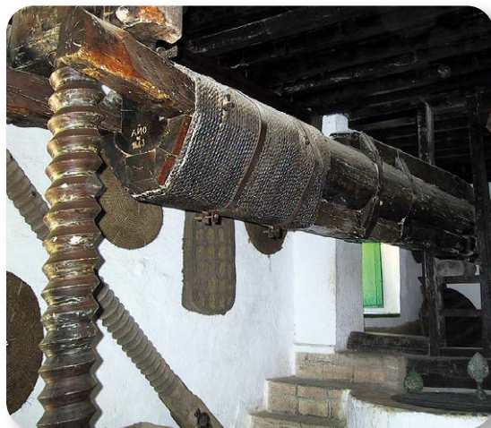
El lagar de Torrijos se ha convertido en un ecomuseo que conserva alguna de las piezas que permitían su función como tal lagar (especialmente la prensa). En él se desarrollan actividades de educación ambiental, ofertadas por el parque natural.

Siguiendo el recorrido, como a unos 700 metros llegaremos a los restos del antiguo lagar de Pacheco, junto al cual nos encontramos los restos de una era, donde era trillado el trigo antes de ser molido, obteniéndose, así, la harina necesaria para la producción de pan en los hornos de leña.