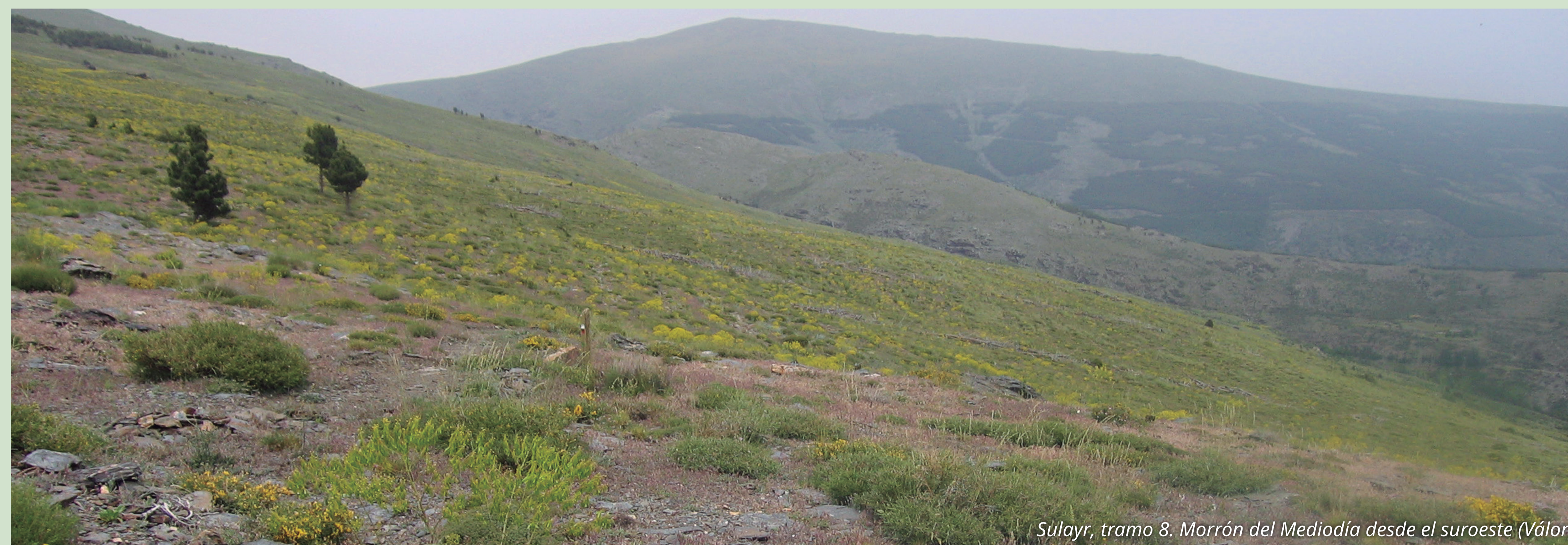
Sulayr, tramo 8. Morrón del Mediodía desde el suroeste (Válor).

Una vez alcanzado este itinerario circular tenemos la opción de tomar una u otra dirección, bien hacia el entorno del Puerto de la Ragua, que transcurre gran parte de su recorrido por pista forestal, o en el otro sentido, hacia poniente, por una quebrada vereda bajo la cumbre el San Juan. En ambas direcciones disfrutaremos de interesantes vistas de la agreste geografía alpujarreña, ya que el trazado del sendero está en torno a los dos mil metros de altura, en el umbral de la alta montaña.