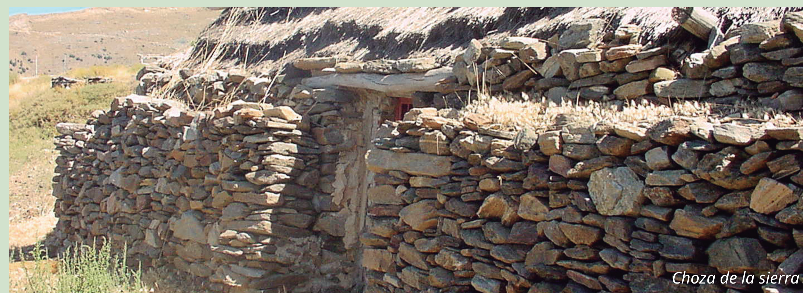
Choza de la sierra

El recorrido del Sendero Sulayr en torno a Sierra Nevada atraviesa el término municipal de Nigüelas por encima de los dos mil metros de altura, en el paraje conocido como Rinconada de Nigüelas, en la cabecera del Río Torrente. En este espectacular lugar, presidido por la cumbre del Cerro del Caballo (3.011 m), el Sendero Sulayr se puede tomar en cualquiera de las dos direcciones de su recorrido circular. El tramo 2 Rinconada de Nigüelas-Cortijuela transcurre por los ríos Dúrcal y Dílar, en un itinerario panorámico con grandes pendientes, atravesando lomas y barrancos, mientras que el tramo 3 Rinconada de Nigüelas-Tello se adentra casi siempre por pista forestal en el Barranco del Río Lanjarón.