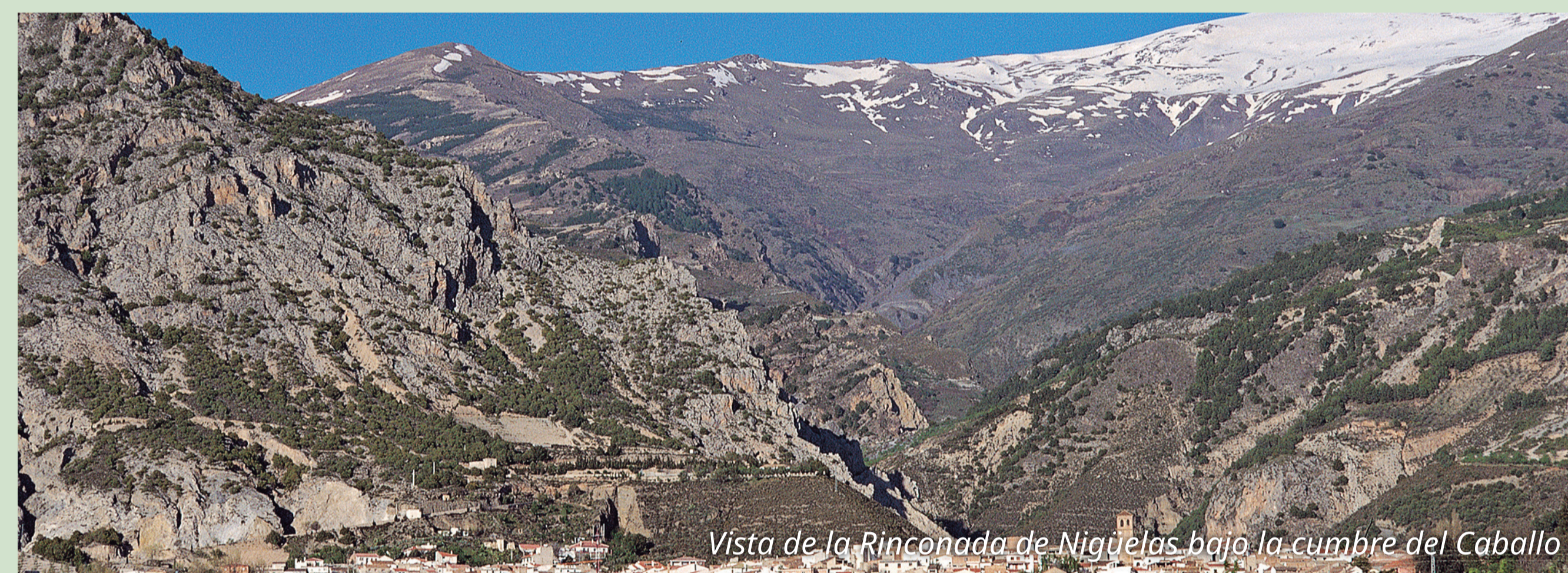
Vista de la Rinconada de Nigüelas bajo la cumbre del Caballo

Este gran itinerario panorámico recorre la media y alta montaña, atravesando lomas y barrancos, bosques, prados y piornales, con una flora y fauna muy diversa. También encontramos antiguos cortijos, banales, acequias, balsas, apriscos... que han contribuido a la formación del paisaje igualmente único de Sierra Nevada.