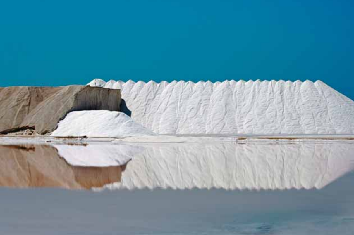
GUILTERMO CORNELLO CONSUEGRA "ORO BLANCO"