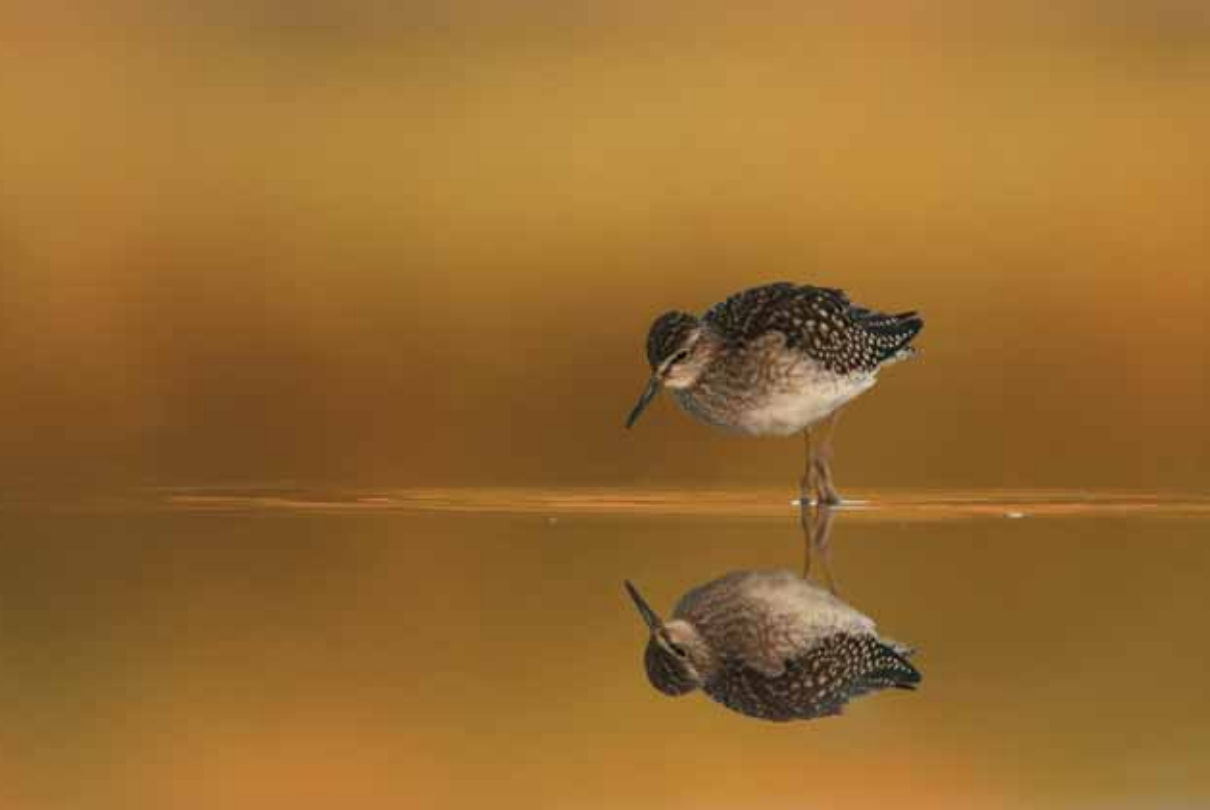
ALFONSO ROLDÁN LOSADA "REFLEJOS EN LA LAGUNA"