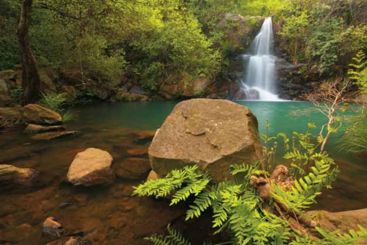
YOLANDA LUQUE COSTE "ENERGÍA POTENCIAL"