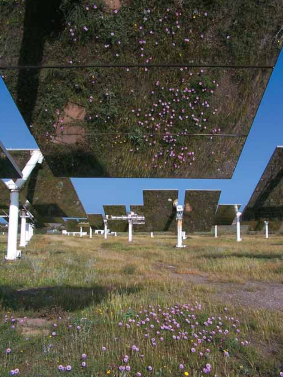
RAFAEL RAMOS FENOY "ENERGÍA ECOLÓGICA"