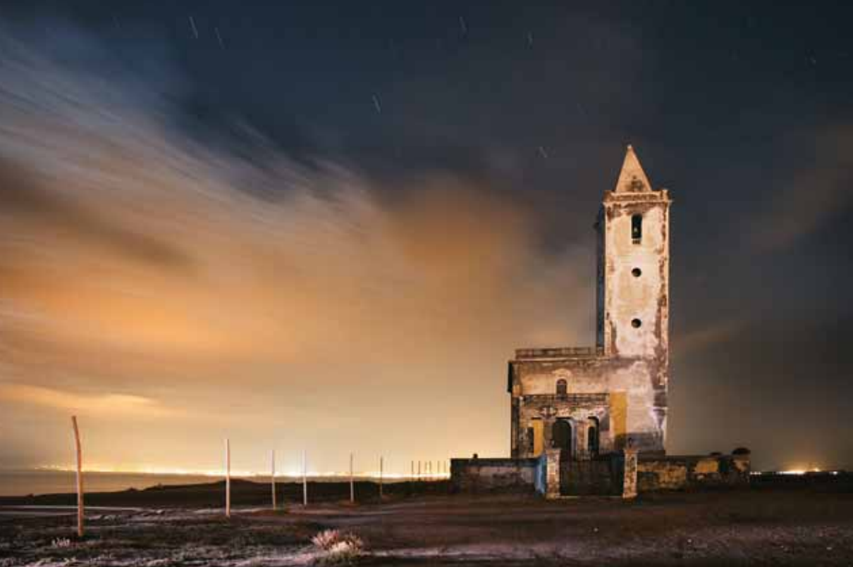
JOSÉ ANTONIO FERNÁNDEZ SALAS "IGLESIA DE SAN MIGUEL" (PARQUE NATURAL CABO DE GATA - NÍJAR)