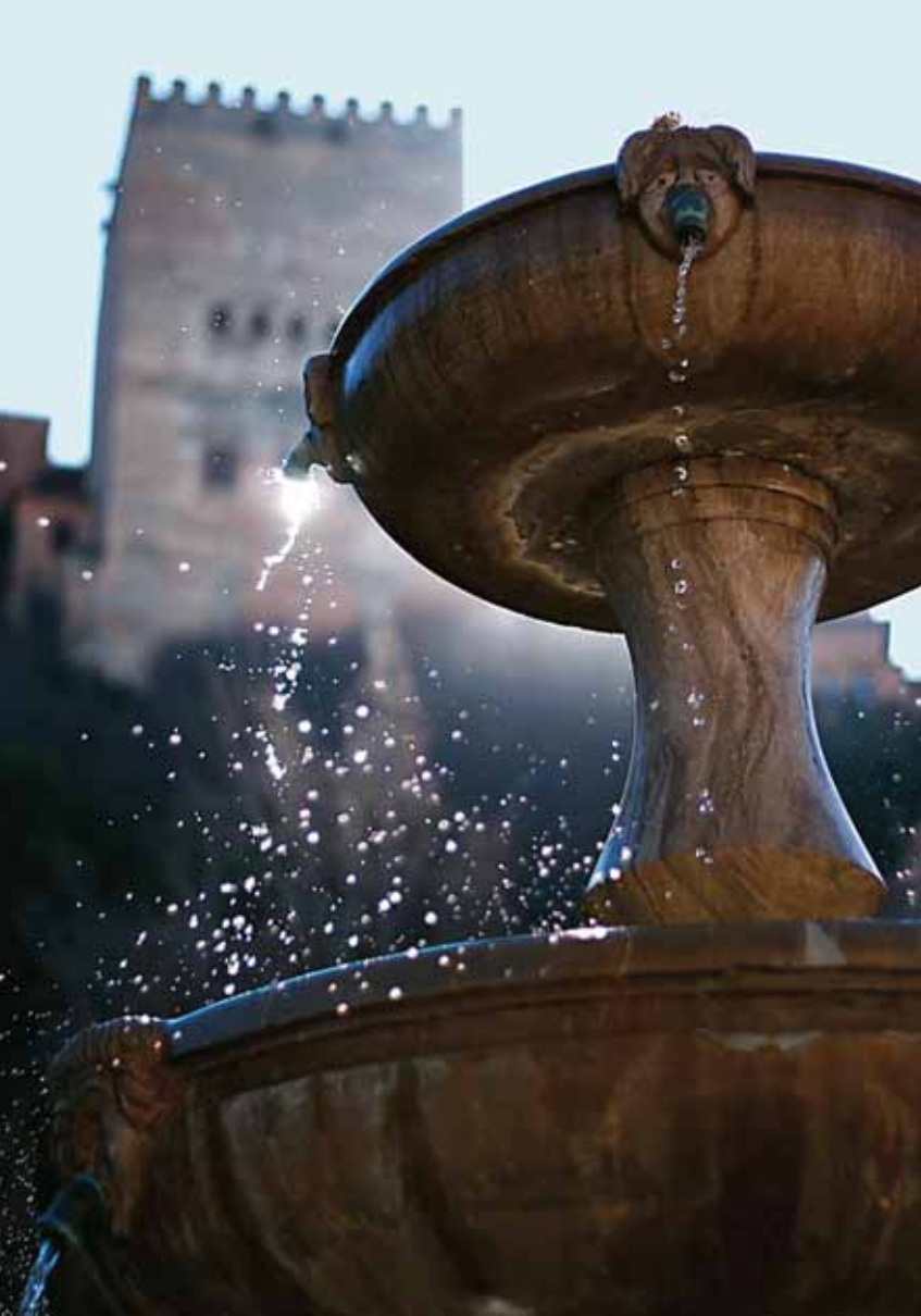
DANIEL NUEVO DUQUE "FUENTE ALHAMBRA"