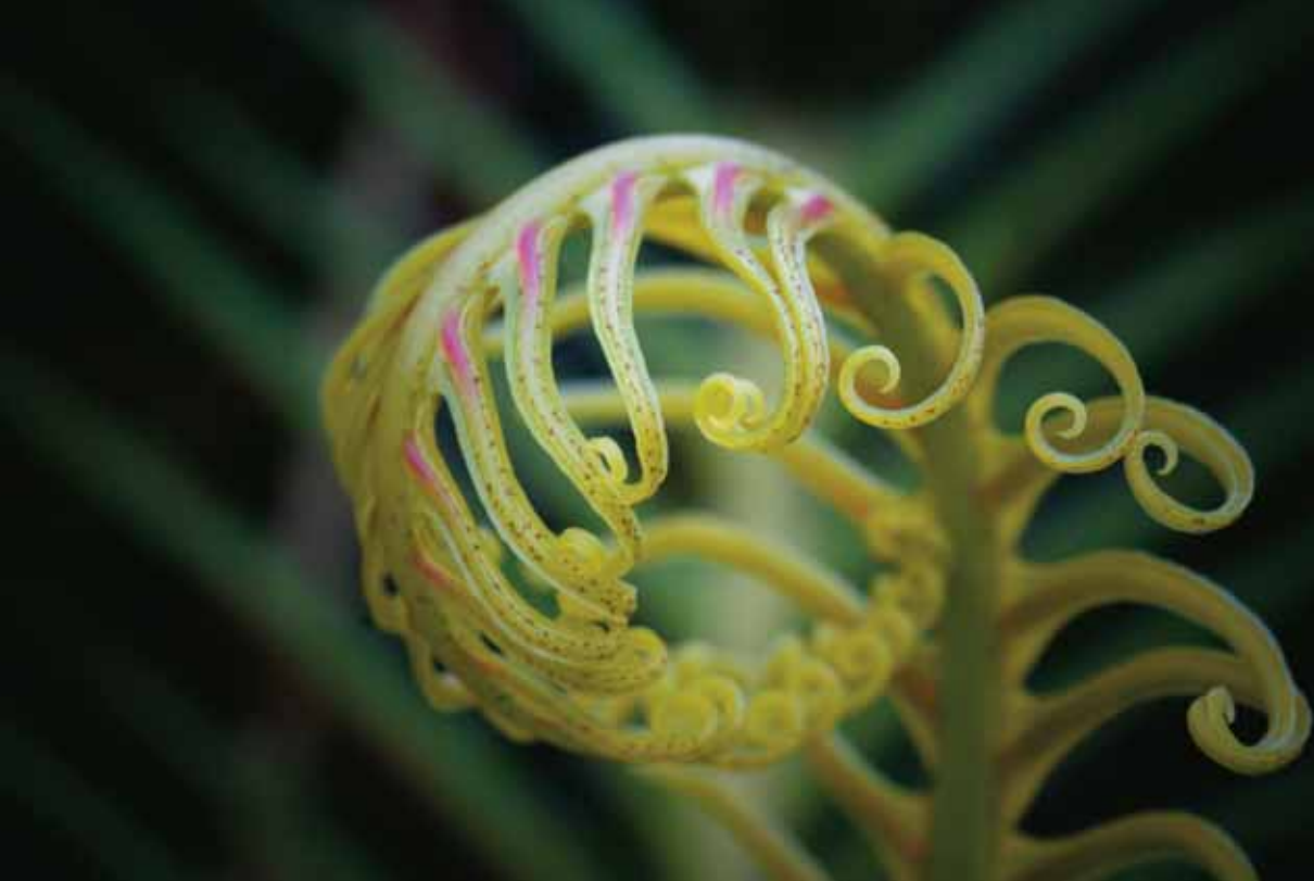
RAFAEL RAMOS FENOY "HELECHO"