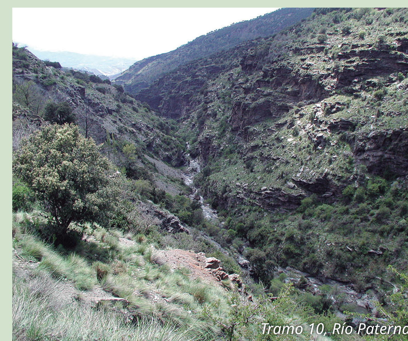
Tramo 10, Río Paterna