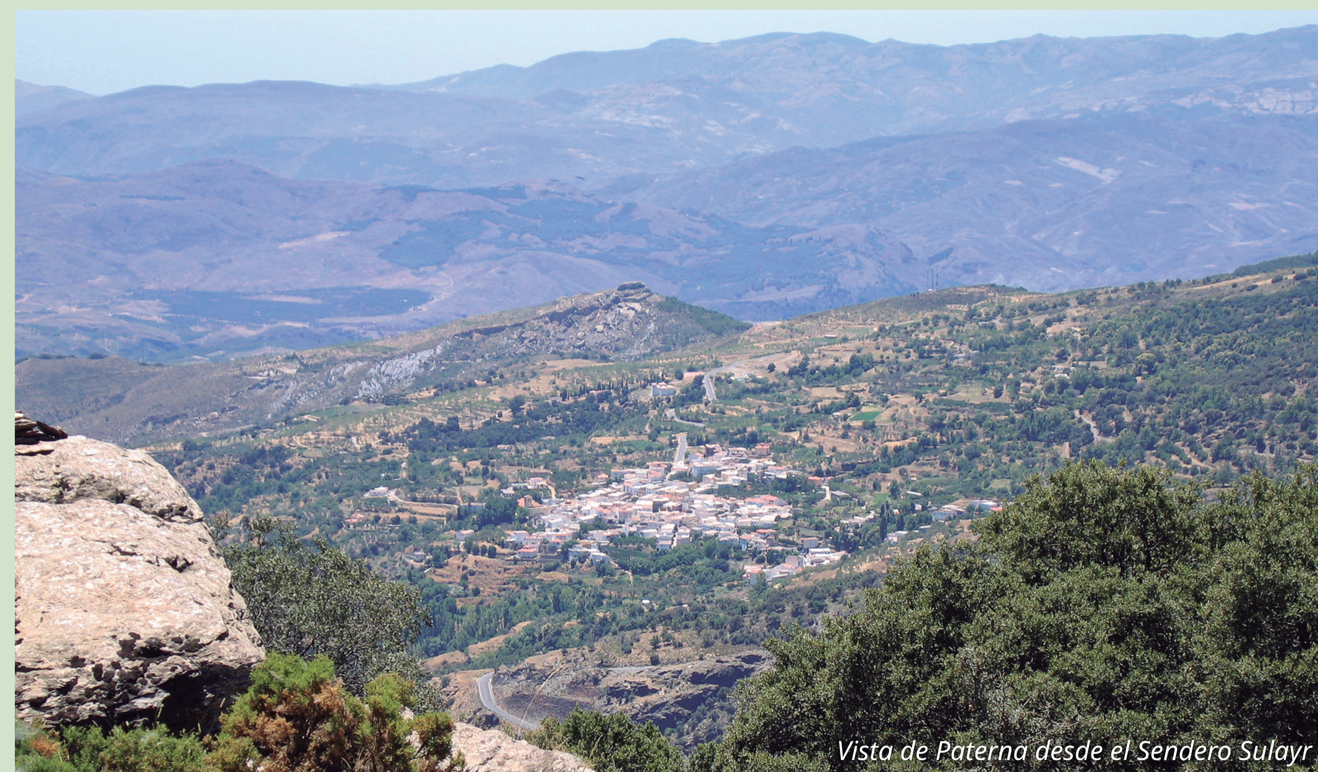
Vista de Paterna desde el Sendero Sulayr

Siguiendo la carretera AL-5402 en dirección a Laujar de Andarax, a 4,1 km de Paterna, se encuentra el cruce desde donde parte la pista forestal que a lo largo de 7,2 km asciende a la sierra. El recorrido del Sendero Sulayr atraviesa la pista en el cruce de Cuatro Caminos, a 1.735 m de altura, en el tramo, Arroyo del Riachuelo-Cerecillo. En este punto, tenemos la opción de tomar en una u otra dirección el recorrido circular del sendero. En ambos sentidos, podemos disfrutar de atractivas vistas que abarcan desde las cumbres de la sierra hasta el horizonte marino.. Por lomas y barrancos el sendero atraviesa franjas de pinar de repoblación y bosquetes de encinas autóctonas, en un paisaje agreste pero también humanizado, con numerosos restos de actividades agrícolas y ganaderas (banales, eras, cortijos ruinosos, acequias, etc.). Una variada fauna habita este territorio, siendo fácil sorprender durante el itinerario algún ejemplar de cabra montés, o admirar el majestuoso vuelo del águila real dominando el valle.