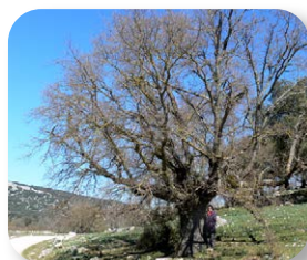
En las inmediaciones de La Nava veremos grandes ejemplares de quejigo

debido a la fertilidad de su suelo. Hoy en día se puede observar los rebaños de ovejas y cabras que siguen pastando plácidamente en este lugar, proporcionando la leche con la que se elaboran los magníficos quesos artesanales de las Sierras Subbéticas.