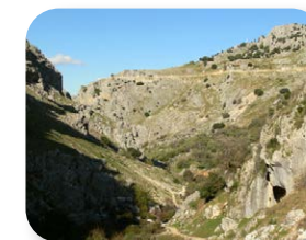
Cerro de los Murciélagos desde el Cañón del Río Bailón

Al salir de este bosque, la geología vuelve a tomar el protagonismo de la ruta, ya que ante nosotros se presenta el Cañón del Río Bailón, una espectacular garganta excavada por el río, donde el agua ha modelado un paisaje sorprendente con enormes paredes rocosas. Además, en el cañón hay numerosos abrigos, como la Cueva del Fraile [9], llamada así por una roca que hay en su interior y que se asemeja a un monje encapuchado.