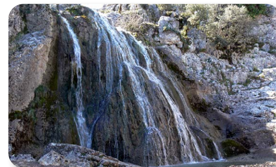
Las Chorreras es uno de los parajes más visitados del Parque Natural

A nuestra izquierda dejaremos un pequeño puente por el que pasa el Río Bailón y, tras un recorrido por