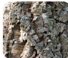
El corcho supone un importante aprovechamiento de los montes

Pero el corcho también cumple una importante función en el árbol y en su entorno, ya que lo protege de las condiciones extremas del clima mediterráneo, como la sequía, las altas temperaturas estivales y los incendios.