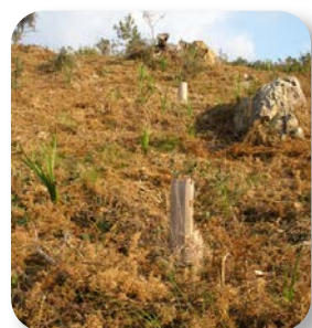
Las repoblaciones tienen en estos montes muchas posibilidades de éxito

Había que tomar algunas medidas y así ocurrió: a partir de 2001 en estos montes se puso en práctica un modelo de gestión que se basa en cerramientos, para no permitir el acceso de grandes herbívoros, y en las repoblaciones. El modelo ha dado sus frutos y ahora está siendo exportado a otros montes.