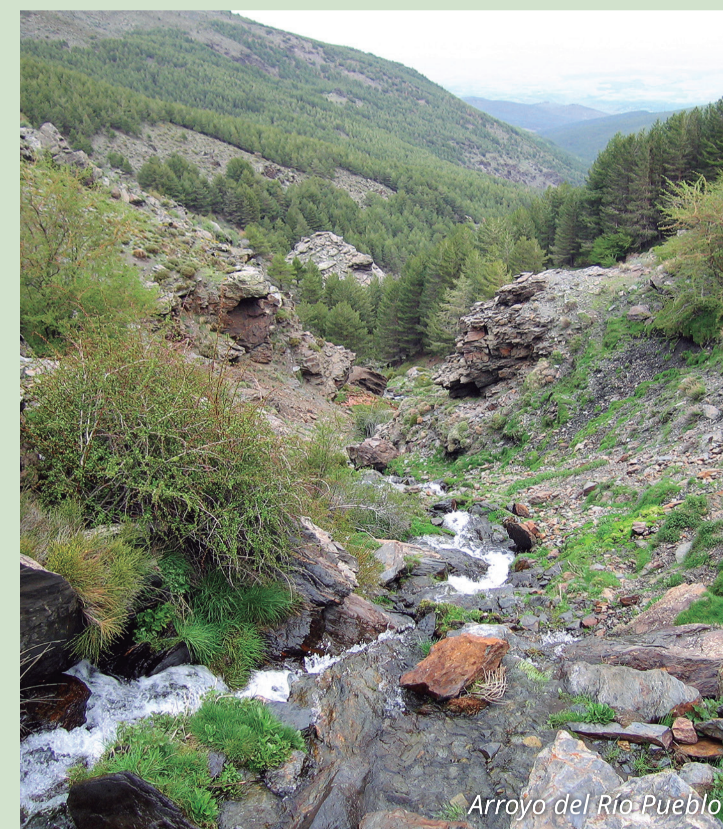
Arroyo del Río Pueblo