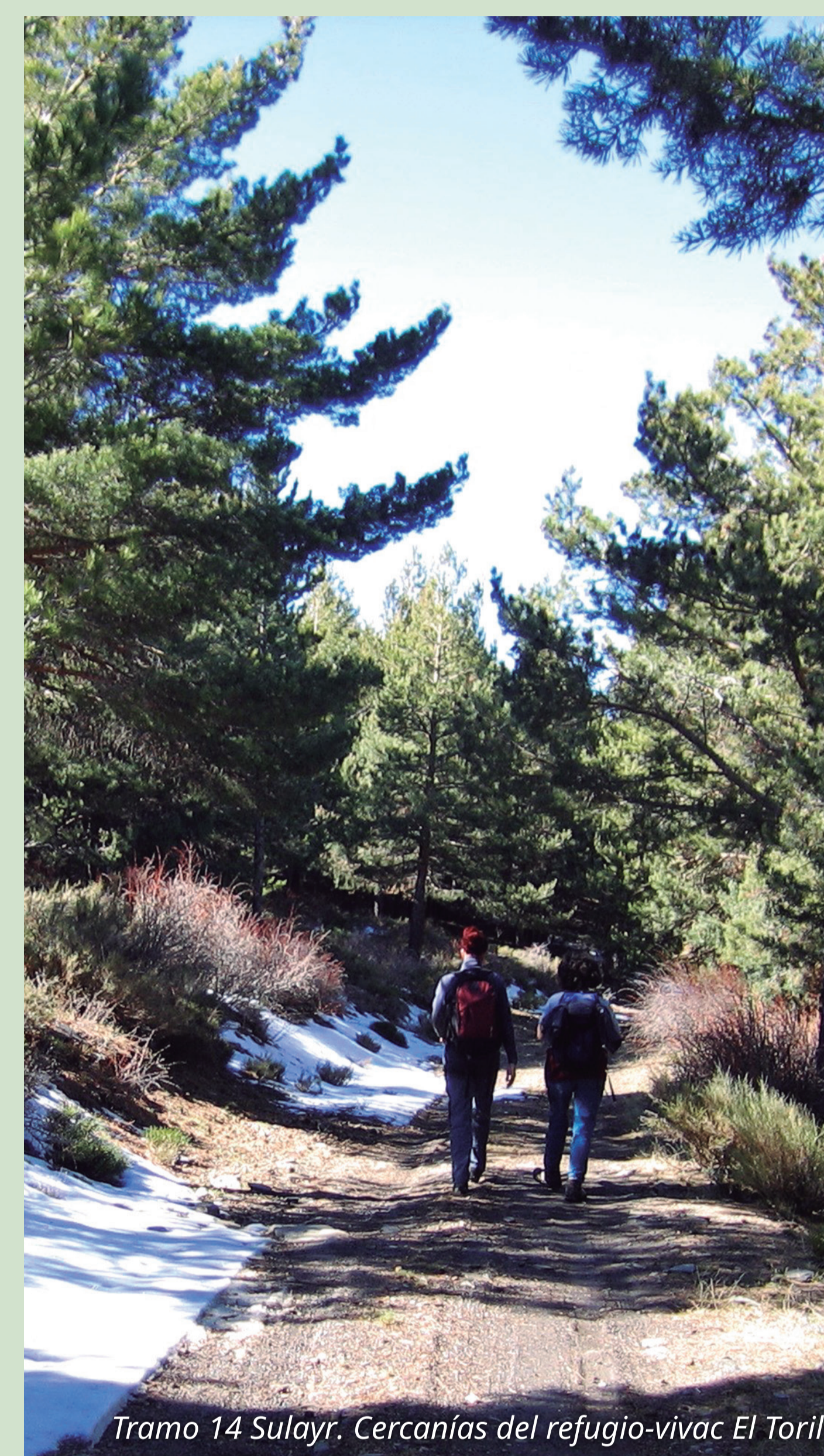
Tramo 14 Sulayr. Cercanías del refugio-vivac El Toril

El sendero Sulayr, en su travesía montañera por la vertiente norte de Sierra Nevada, continúa regalándonos bellas panorámicas de la Sierra y del altiplano del Marquesado. En esta zona atraviesa el término de Dólar, bajo la cumbre del Chullo, y recorre barrancos y lomas entre densos pinares de reforestación y piornales.