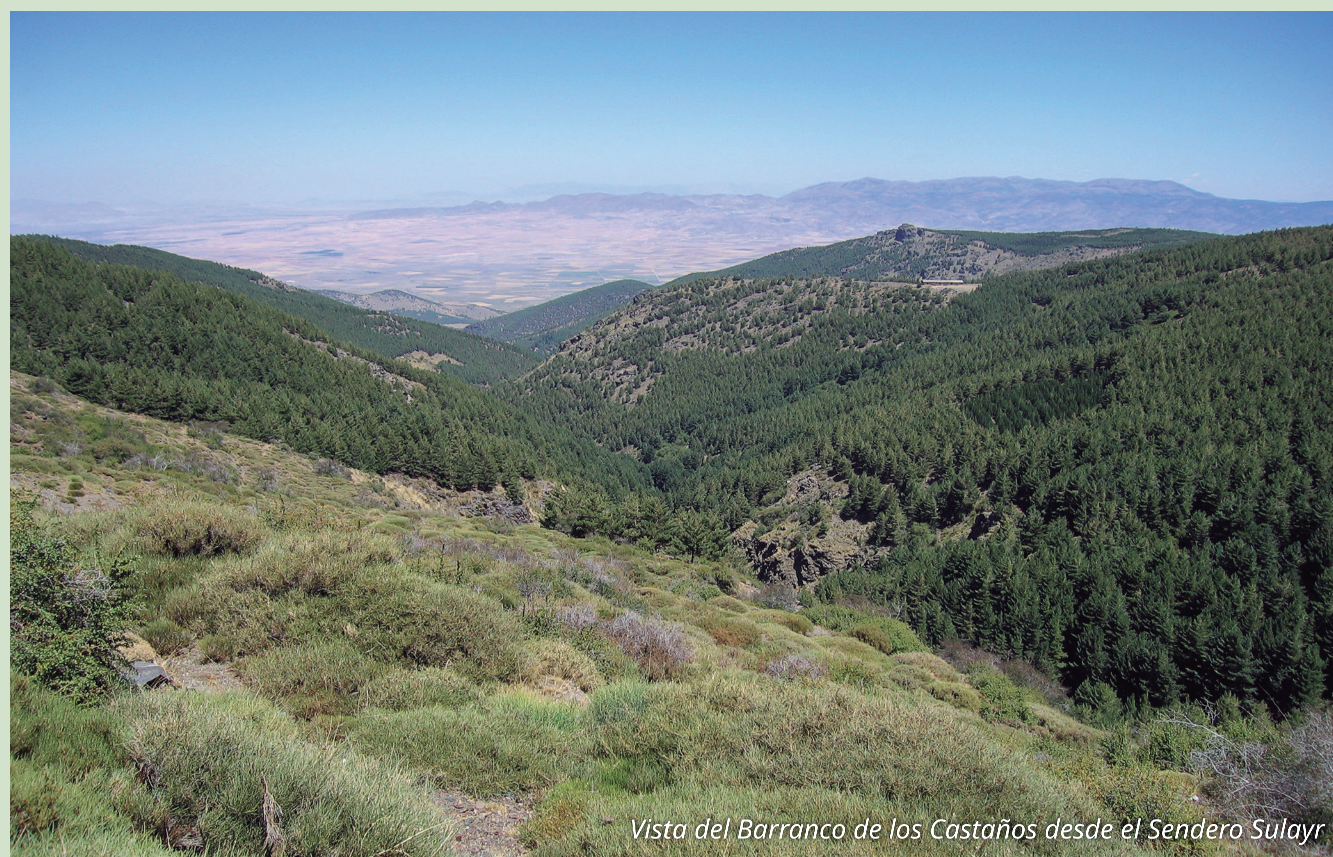
Vista del Barranco de los Castaños desde el Sendero Sulayr

El Sulayr, o GR- 240, es un sendero de gran recorrido y trazado circular. A lo largo de sus 300 km rodea, por caminos tradicionales, pistas forestales y sendas, todo el macizo montañoso de Sierra Nevada. Está dividido en 19 tramos de distinta dificultad según veremos en los carteles de inicio de cada tramo.