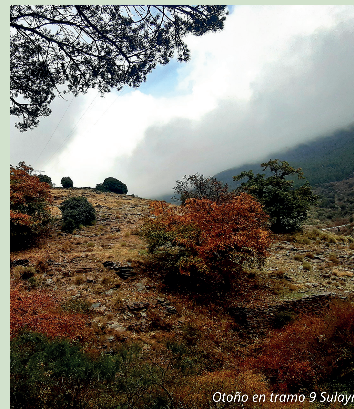
Otoño en tramo 9 Sulayr