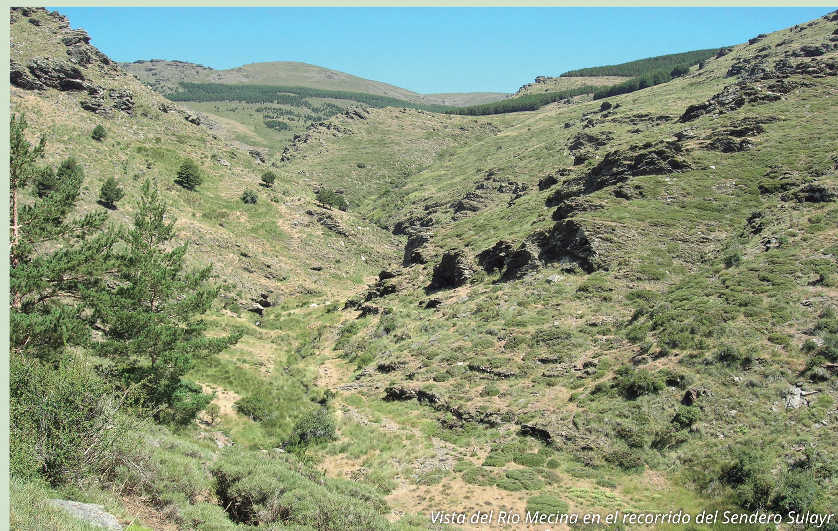
Vista del Río Mecina en el recorrido del Sendero Sulayr

Otra opción es acceder desde el cercano pueblo de Mecina Bombarón, con un recorrido por pista de 12,6 km. Desde el mismo pueblo, C/ Camino de la Sierra, una pista va ascendiendo hasta la pista forestal principal, que coincide con el límite del Parque Nacional en gran parte de su recorrido. Tras tomarla a la izquierda, pasado el collado de Cerro Gordo, encontraremos el Sulayr justo dónde se unen sus tramos 7 y 8.