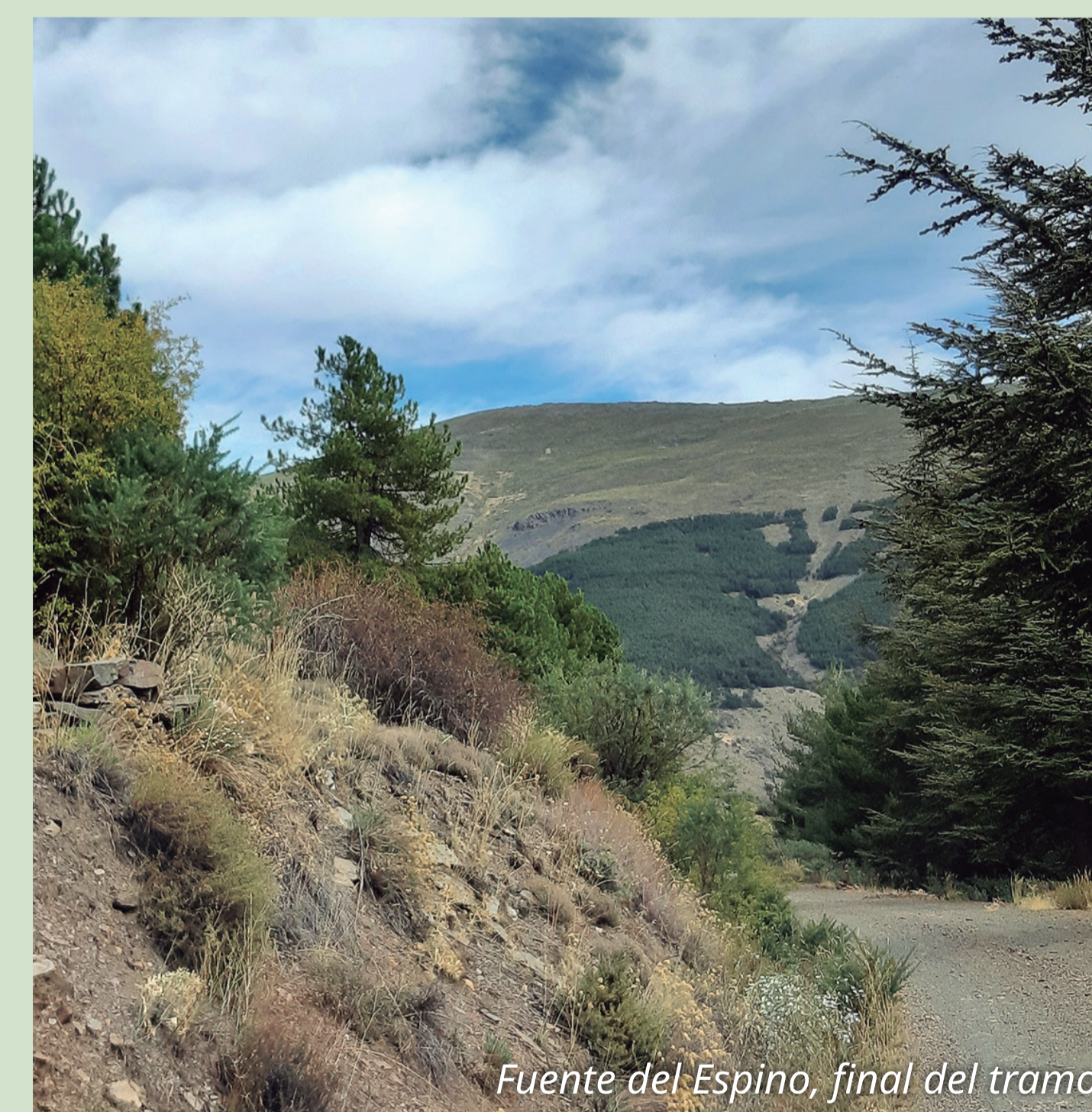
Fuente del Espino, final del tramo