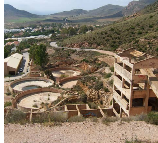
Lavaderos de mineral en Rodalquilar junto a la Casa de Los Volcanes