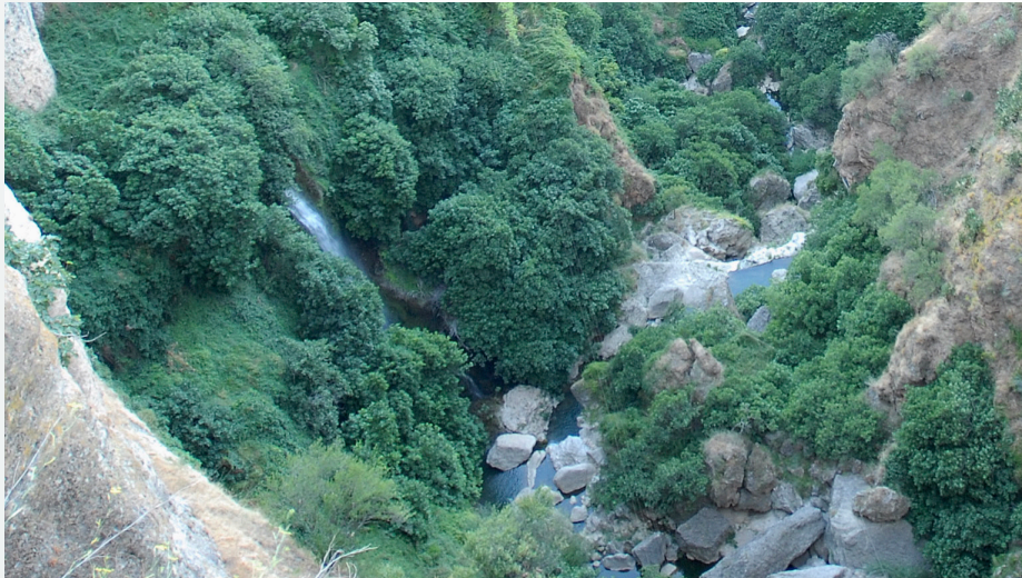
Río Guadalevín a su paso por Ronda. Autor: José González Granados