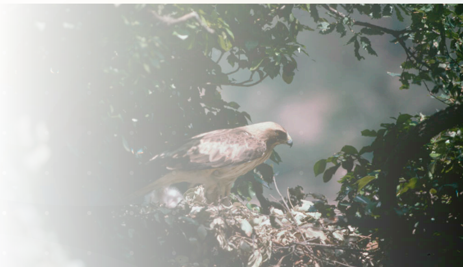
Aguililla Calzada ( Hieraaetus pennatus ) en nido.