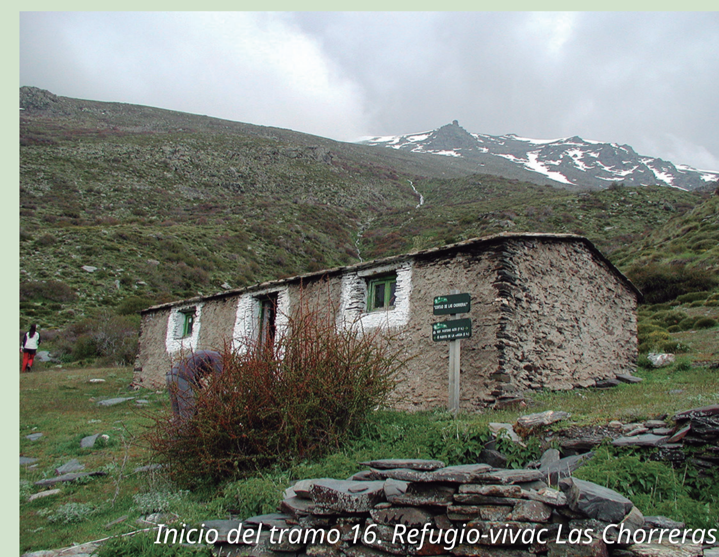
Inicio del tramo 16. Refugio-vivac Las Chorreras

Otra opción es acceder a pie al recorrido del Sulayr, desde Aldeire, a través del Sendero Ragua-Aldeire, alcanzando su trazado en el Refugio de las Chorreras, a 1.930 m de altitud.