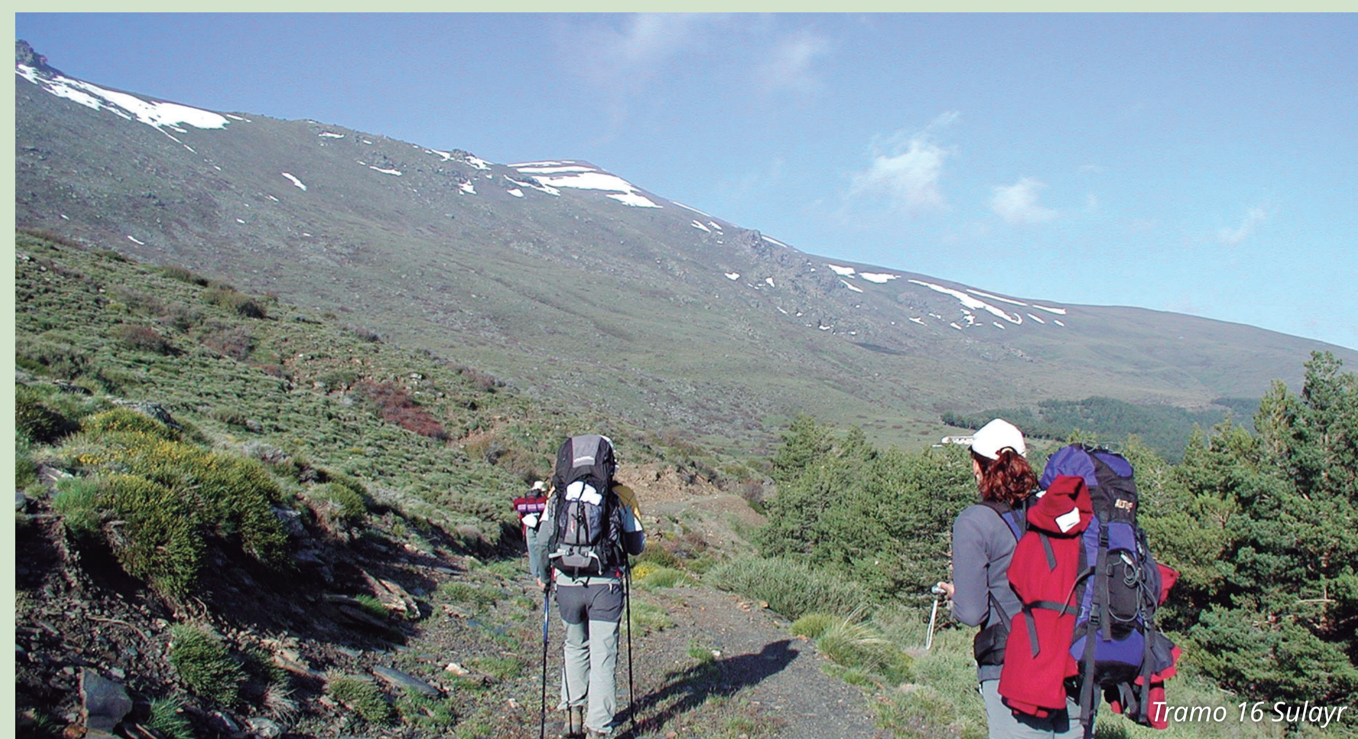
Tramo 16 Sulayr