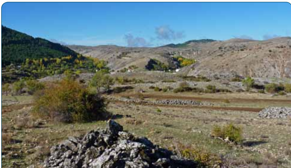
Panorámica desde Los Palancares

La ruta termina bajando hacia el valle del Segura por un lugar de nombre tan significativo como la Cuesta de Despiernacaballos y, ya bajo los pinos laricios o salgareños, se goza de la visión de los escarpados Poyos de la Toba, formaciones rocosas de impactantes contornos, con el ruido de fondo del río Segura y una notable frondosidad al final del recorrido. La etapa acaba en la aldea de La Toba, donde el caminante podrá recrearse con sus vistas sobre el valle del Segura, su abundancia de manantiales y su plácido ambiente rural.