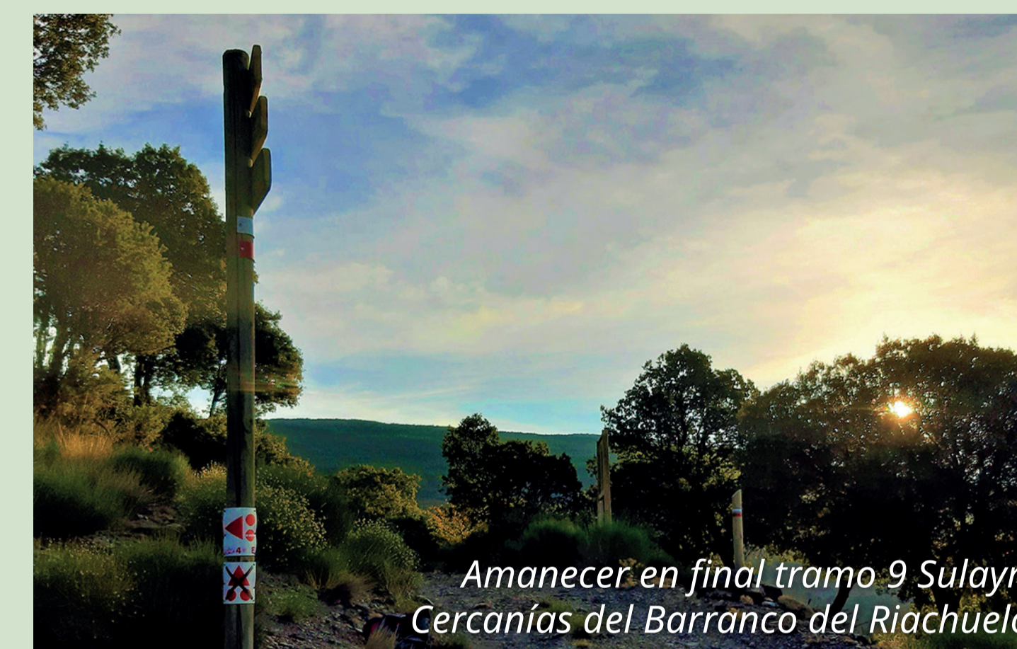
Amanecer en final tramo 9 Sulayr, Cercanías del Barranco del Riachuelo