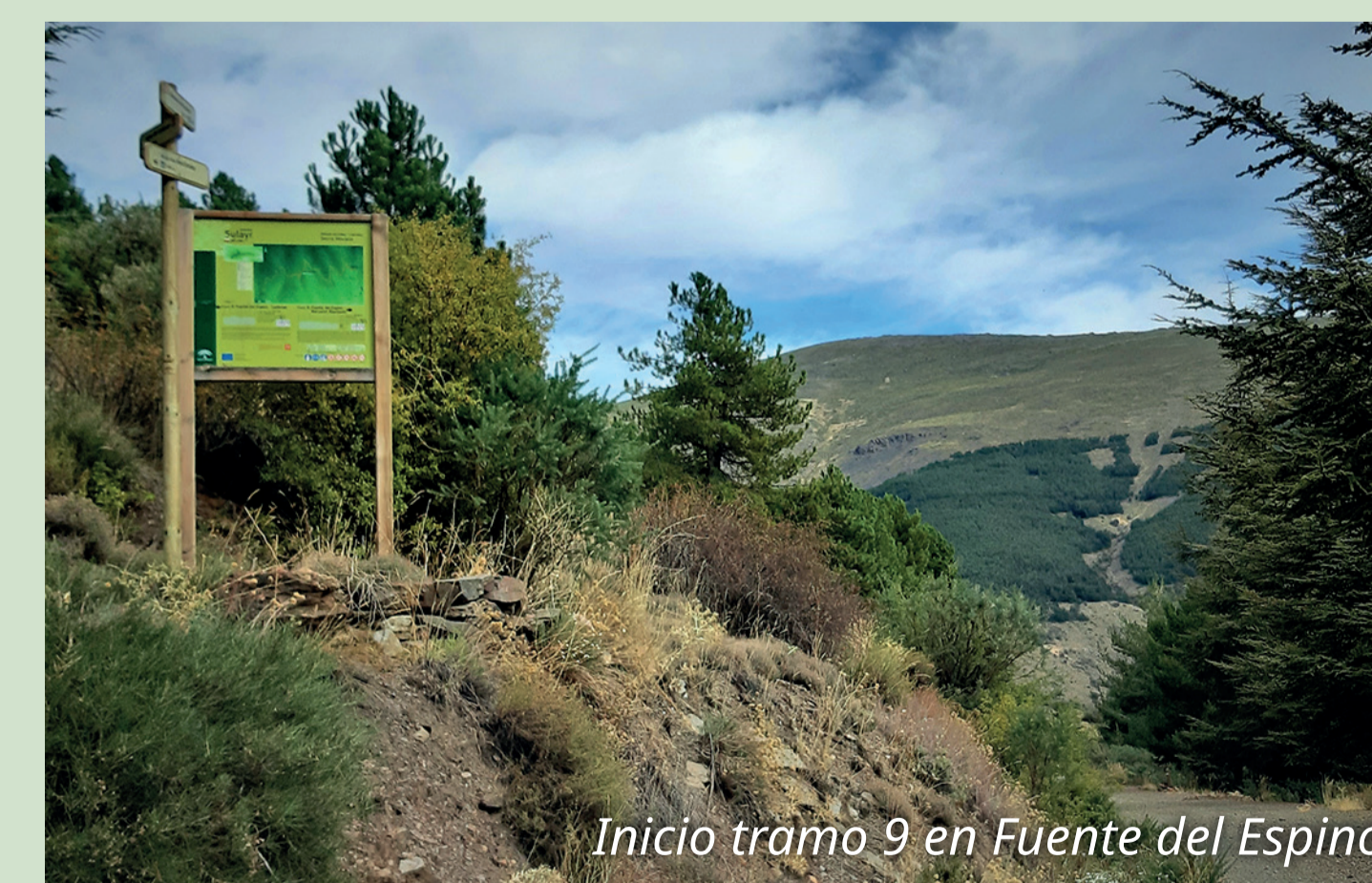
Inicio tramo 9 en Fuente del Espino

SIERRA NEVADA PARQUE NACIONAL PARQUE NATURAL