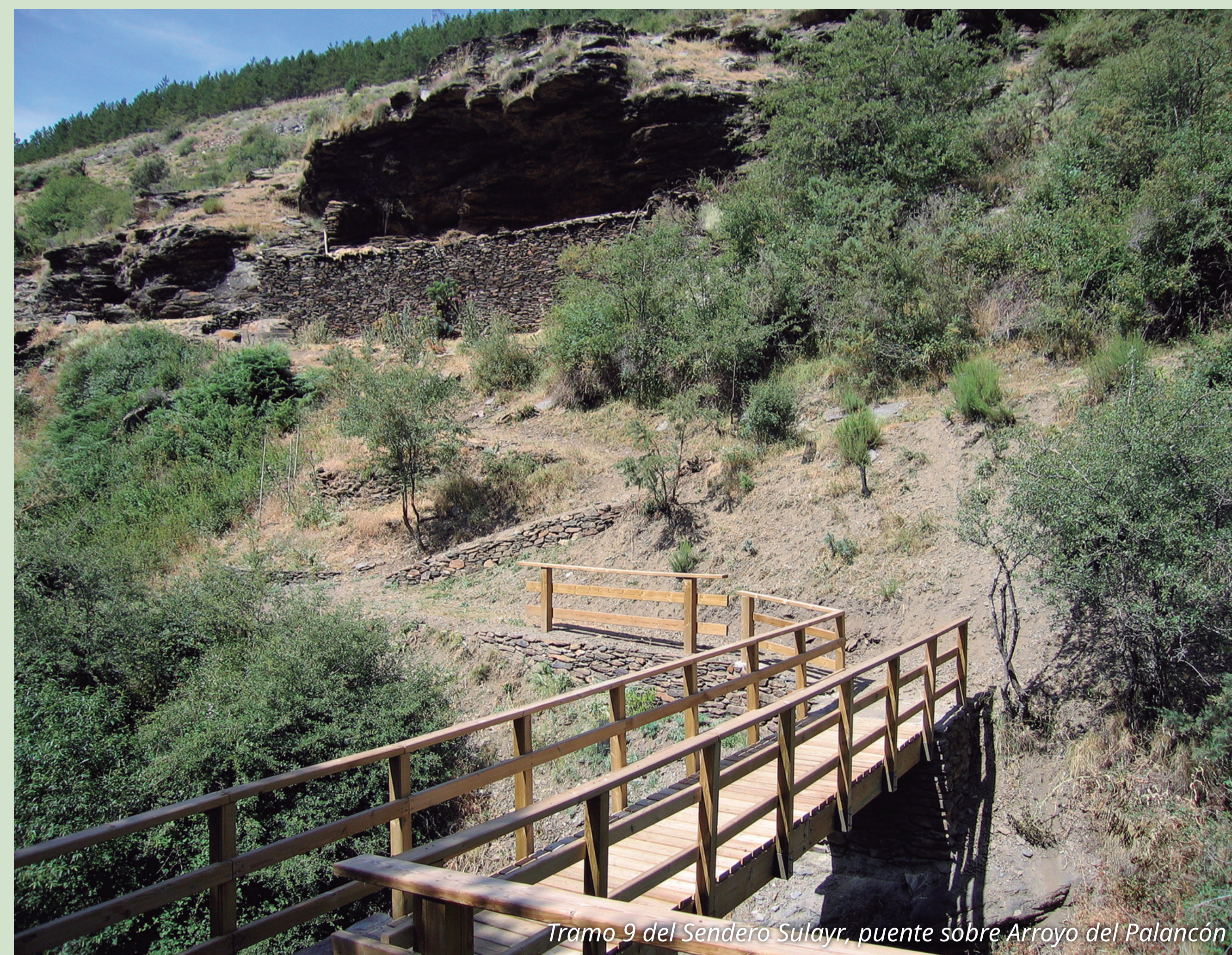
Tramo 9 del Sendero Sulayr, puente sobre Arroyo del Palancon

Por la carretera A-4130, en dirección a Laroles, tomamos el desvío a Júbar, donde a 200 m del cruce parte la pista que a lo largo de 11,9 km asciende a la Sierra. El Sendero Sulayr, correspondiente en esta zona al tramo 9 Fuente del Espino-Barranco del Riachuelo, transcurre por la llamada pista perimetral del Parque, a 1900 m de altitud. En el horizonte sur podemos observar la Sierra de la Contraviesa, la de Gádor y el Mediterráneo. A unos 3,4 km, siguiendo la pista en dirección al Puerto de la Ragua, encontraremos el río Laroles. Y, en su acogedor soto, un área recreativa con fuente.