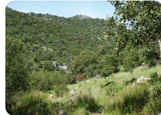
Entre esta vegetación podremos ver o escuchar ruiseñores, mirlos, carboneros, pinzones, mitos, petirrojos, arrendajos, abubillas y surcando el cielo, buitres leonado, milanos o águilas. También hay en la zona ginetas, meloncillos y tejones.

Los juncos y adelfas nos guiarán hasta una pequeña fuente en mitad del recorrido. Se trata de la fuente del Descansadero [4]. Dejándola atrás, avivará nuestro olfato plantas aromáticas como lavanda, tomillo, manzanilla u orégano. Subiremos unos escalones entre álamos blancos a ambos márgenes de la carretera. A nuestra derecha vemos los restos de una antigua cantera y posterior escombrera, hoy sellada. Y a nuestra izquierda, también vestigios de la extracción de arenas blancas del terreno.