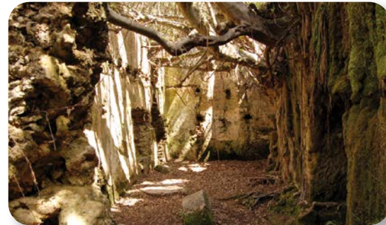
El molino del Susto funcionaba con las aguas del arroyo del Descansadero, desviadas desde una pequeña laguna coronada por una vieja higuera.

Superado el muro, encontramos un pequeño riachuelo, que cruzaremos si la corriente nos lo permite, para llegar a las ruinas de un antiguo molino conocido como el molino del Susto [2]. Entre sus restos y la maraña verde que lo rodea, podemos ver alguna piedra (muela) abandonada, próxima a un salto de agua que da encanto y embrujo al lugar.